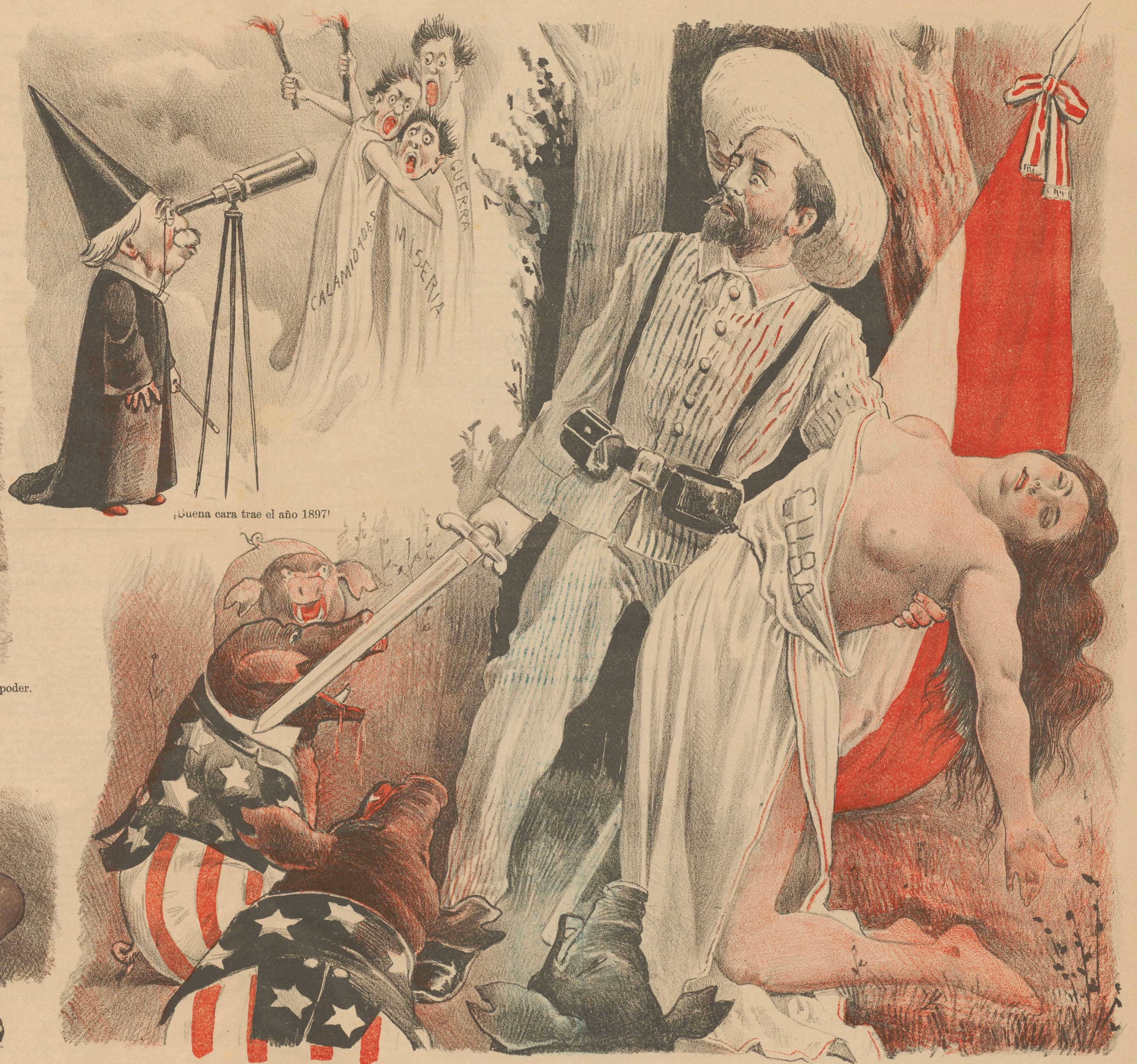
¡Buena cara trae el año 1897!