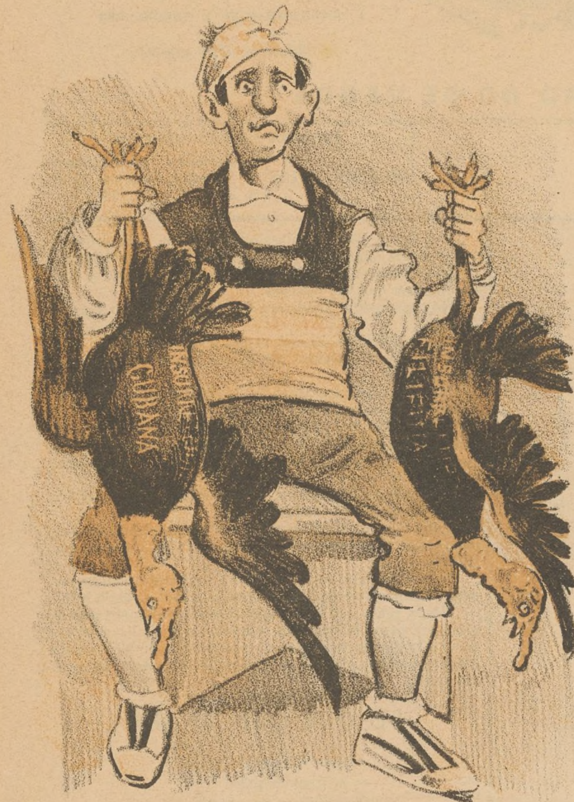
Las víctimas propiciatorias.