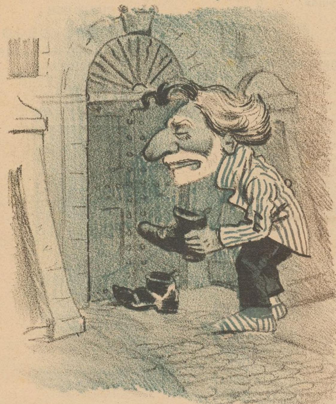
—Vamos, á ver si los reyes me dejan este año el poder.