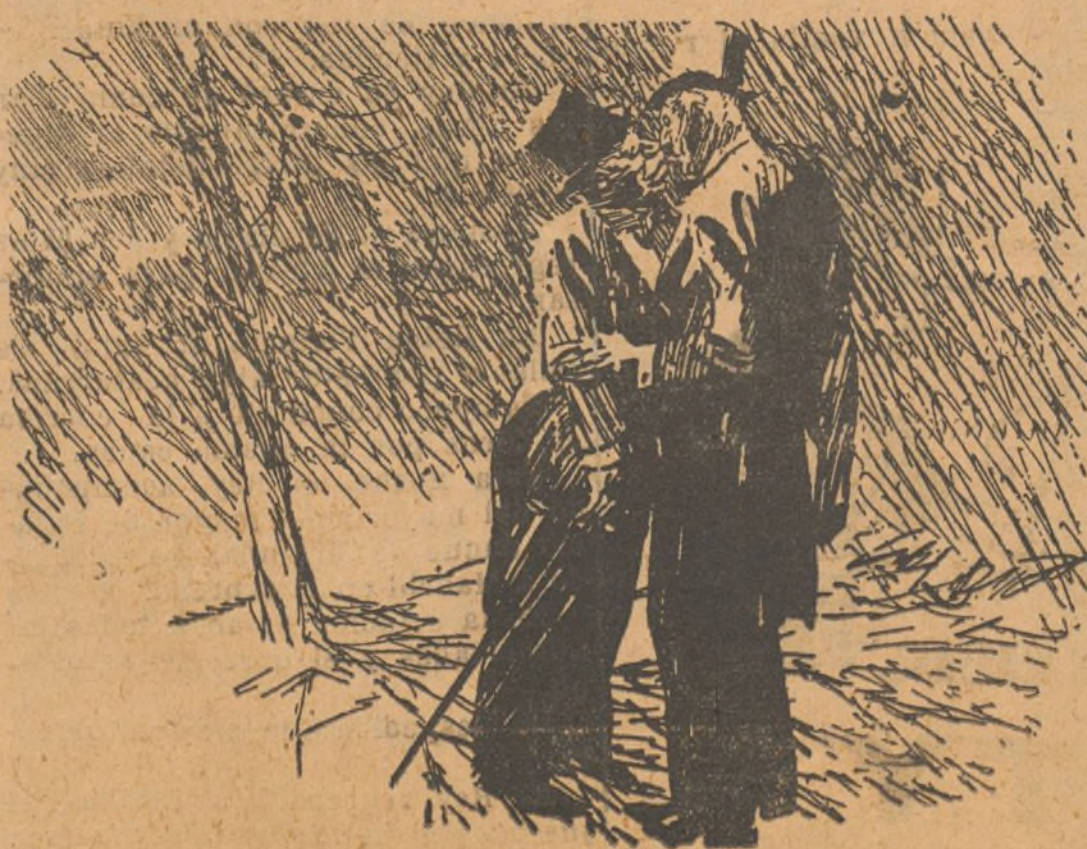
—Dime: ¿dónde vive Tomás Maloney? —Pero, ¡cómo! Tomás Maloney eres tú. —Ya lo sé; pero, ¿dónde vive?