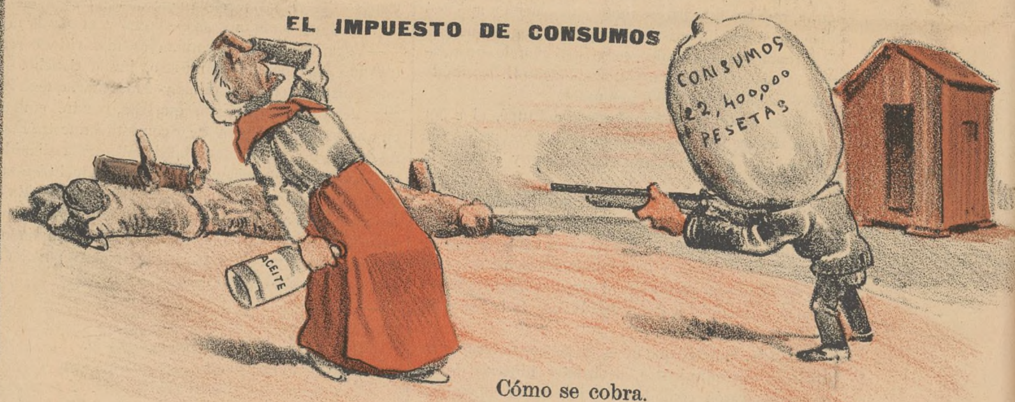
Cómo se cobra.