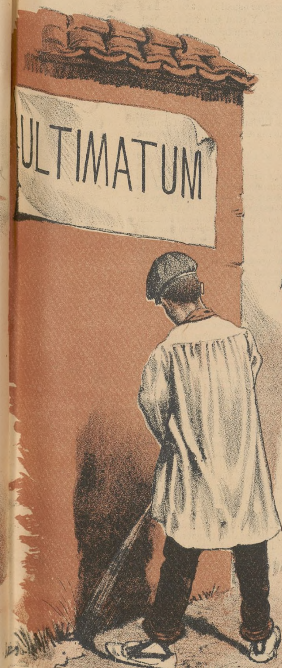
Se prohíbe hacer aguas en este... sitio.