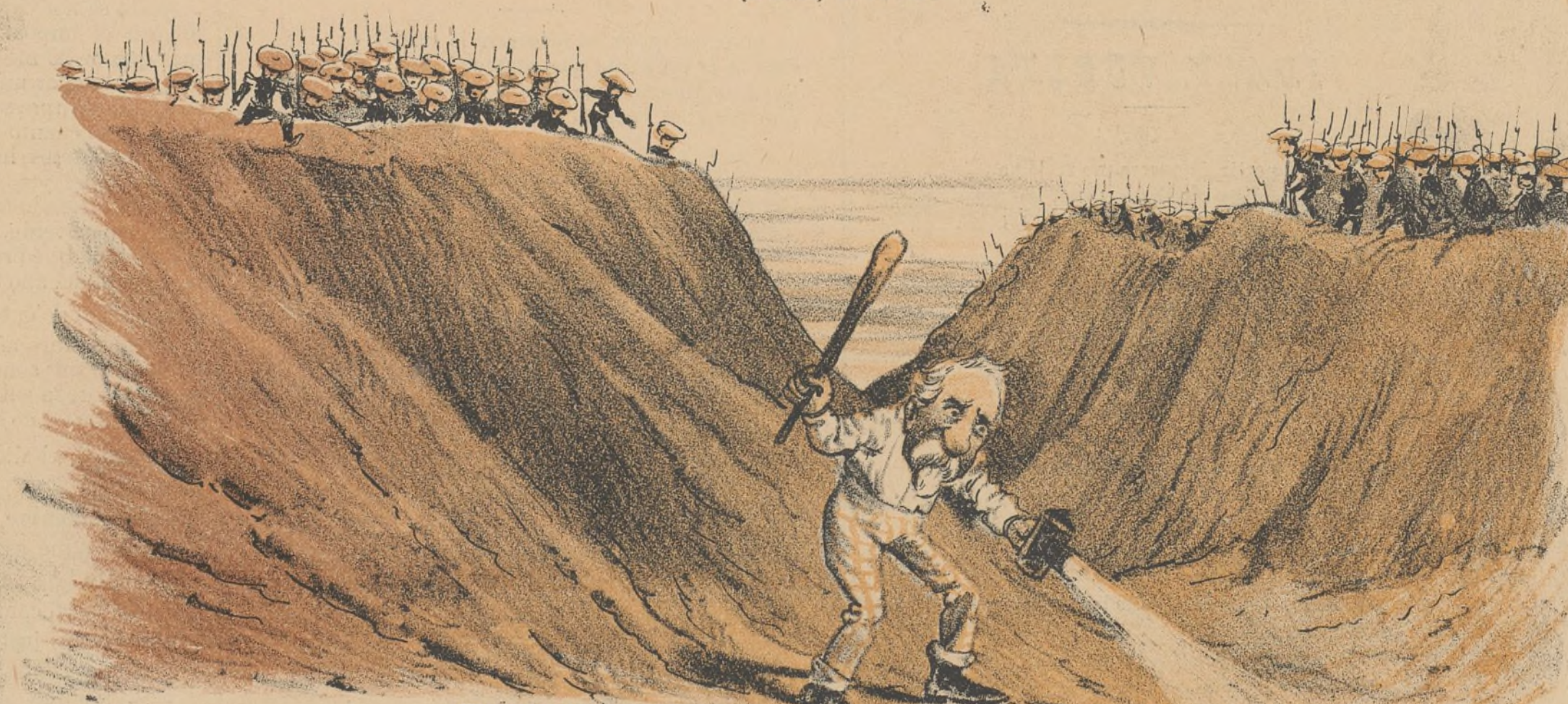
«Tranquila está la venta, no se oye ni un mosquito, caerás en el garlito sin remisión.» (De una zarzuela).