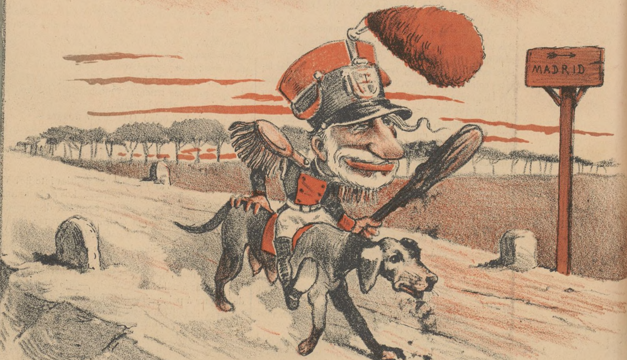
Mambrú se marchó á Ávila, no sé cuándo vendrá, si será por la Pascua ó por la Navidad.