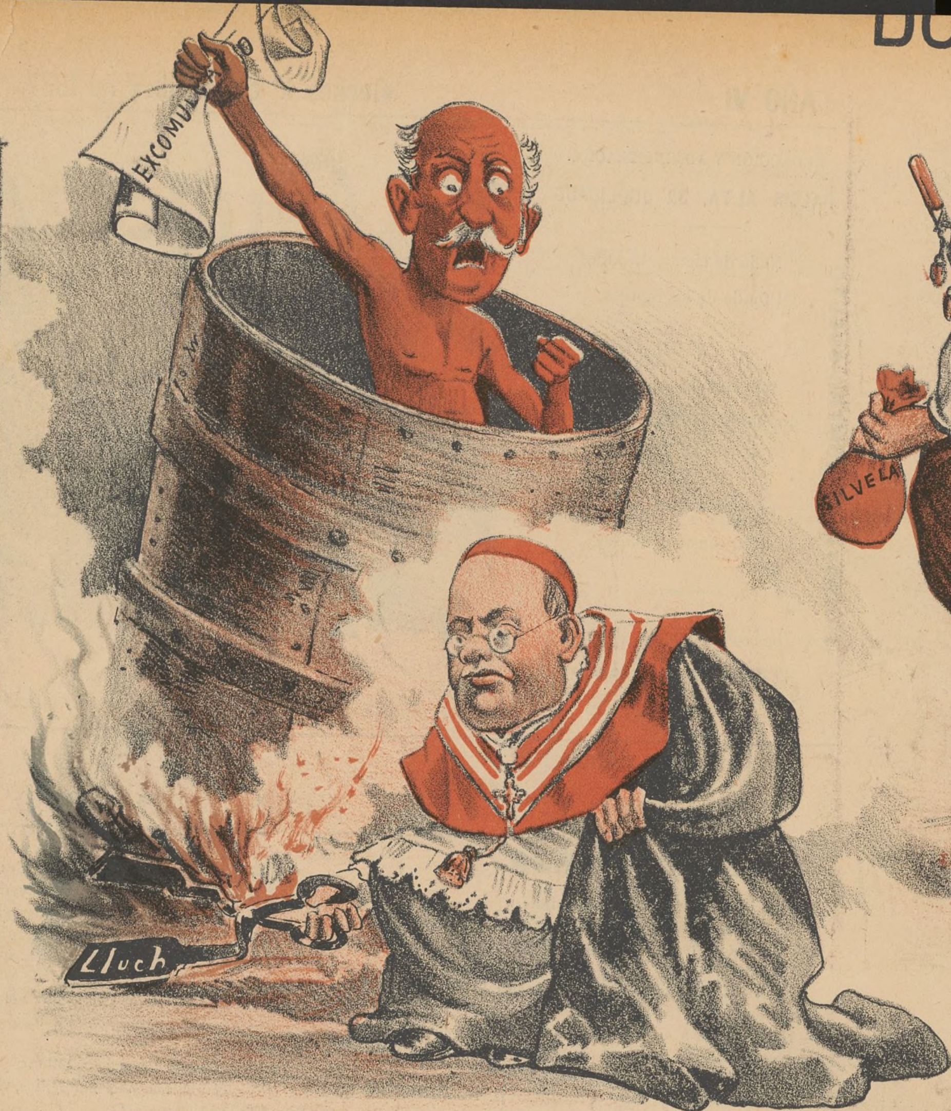
Navarro en los infiernos.