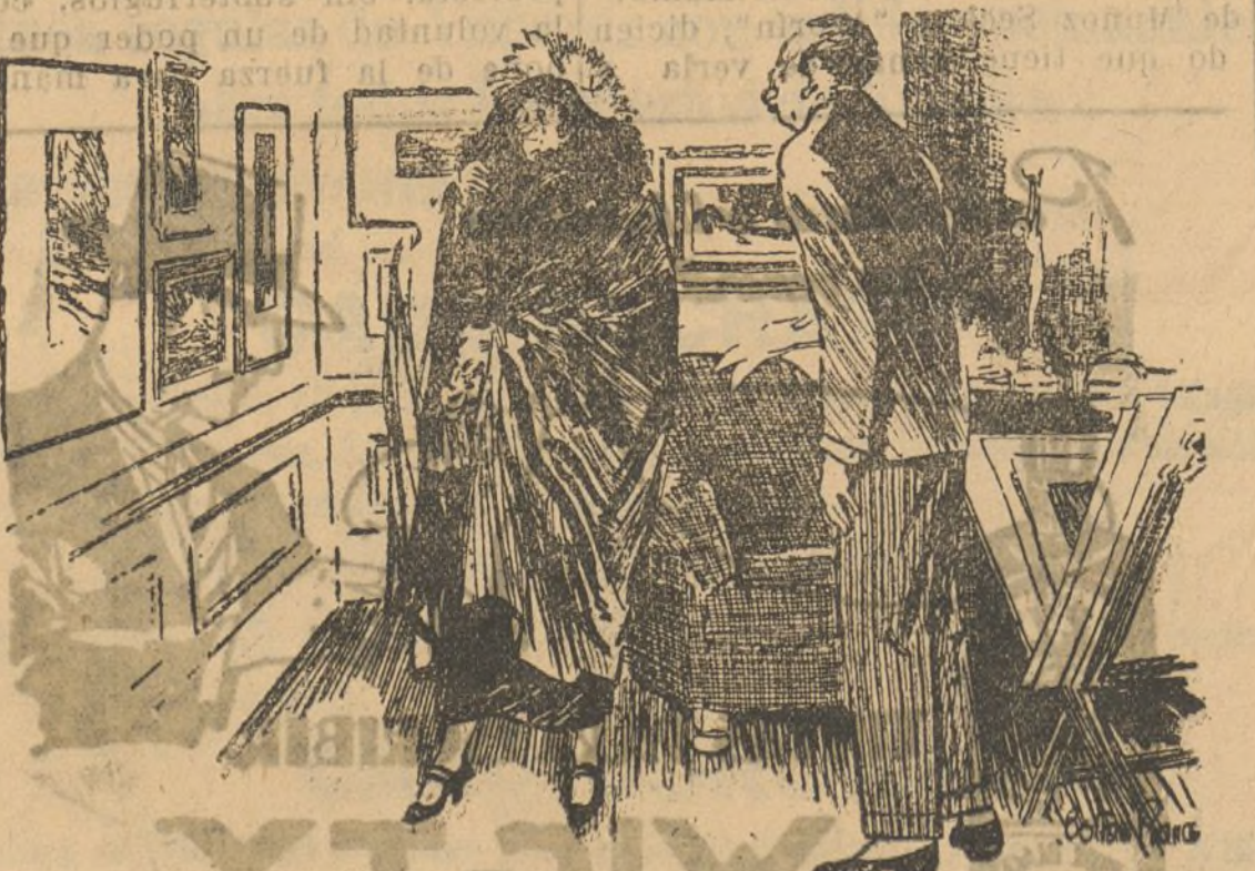
La nueva rica.—¿Y esto que es? El vendedor.—Es un cromo señora. La nueva rica.—¿Es un cromo? ¡Ah! sí! A'ora me acuerdo. ¡Estilo! Un cromo legítimo.