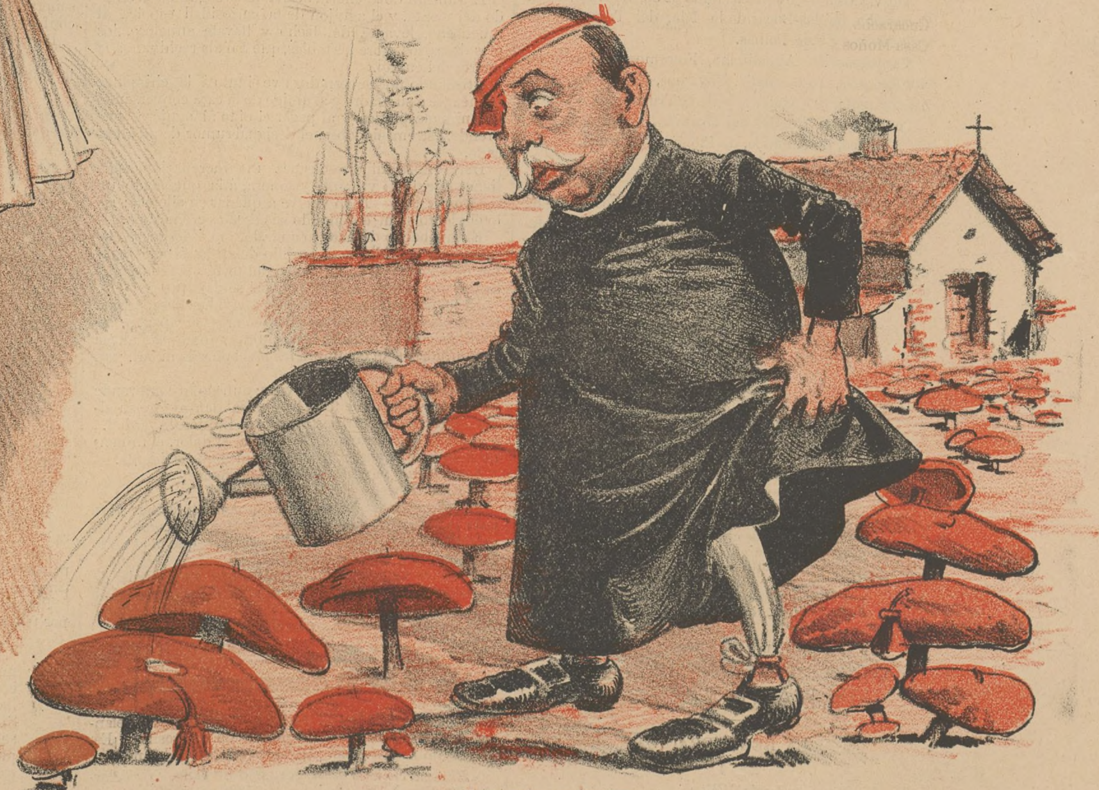
Regando su huerta.