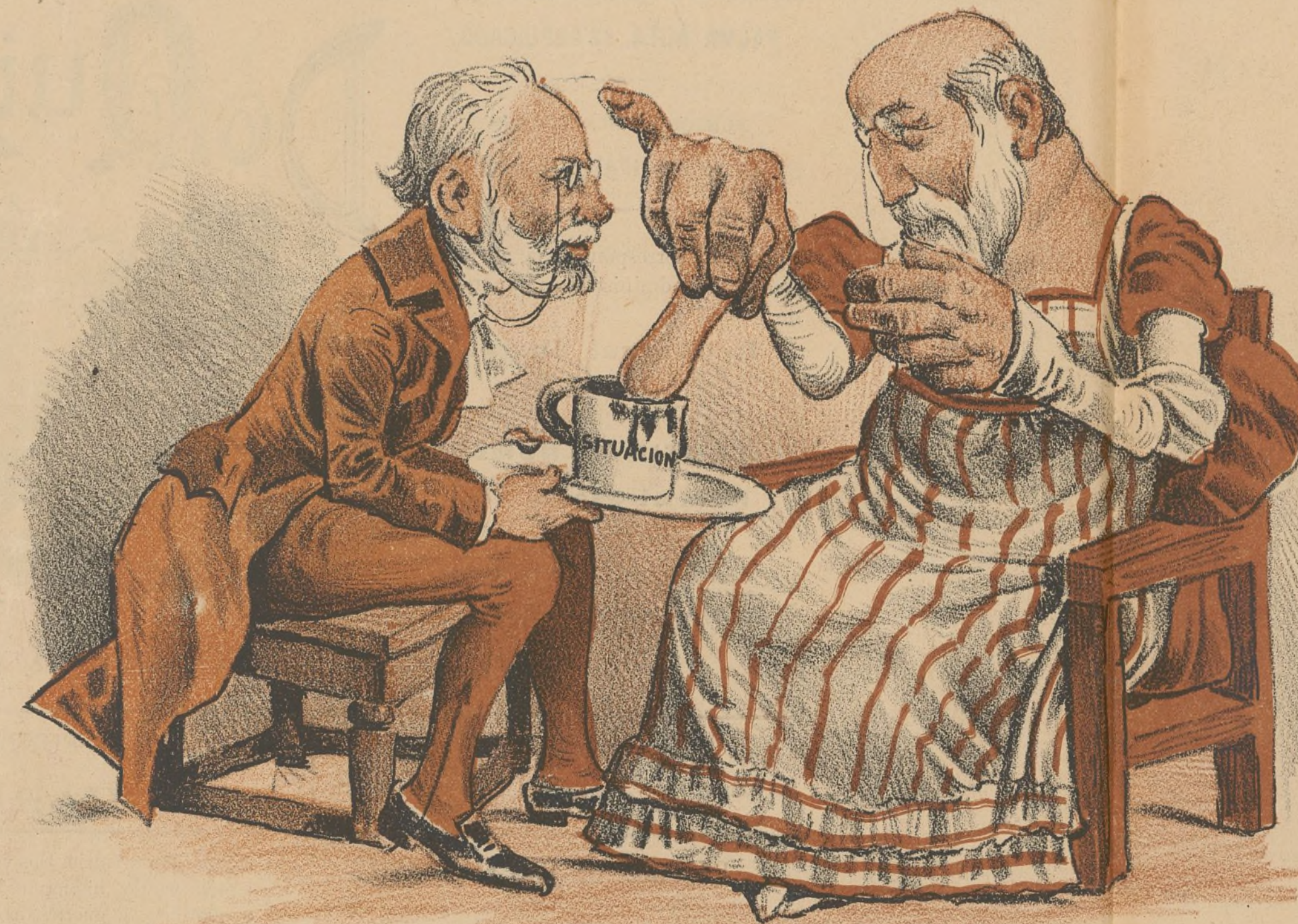
El muerto al hoyo y el vivo al bollo.