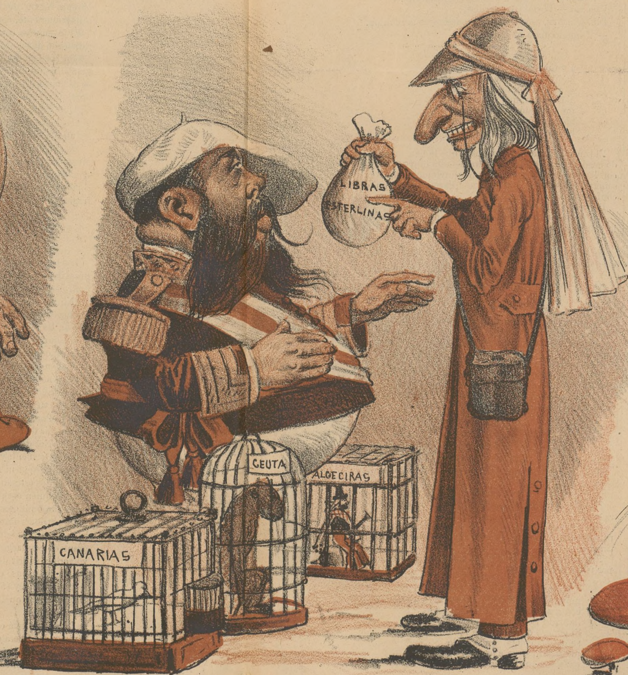
El patriotismo carlista.