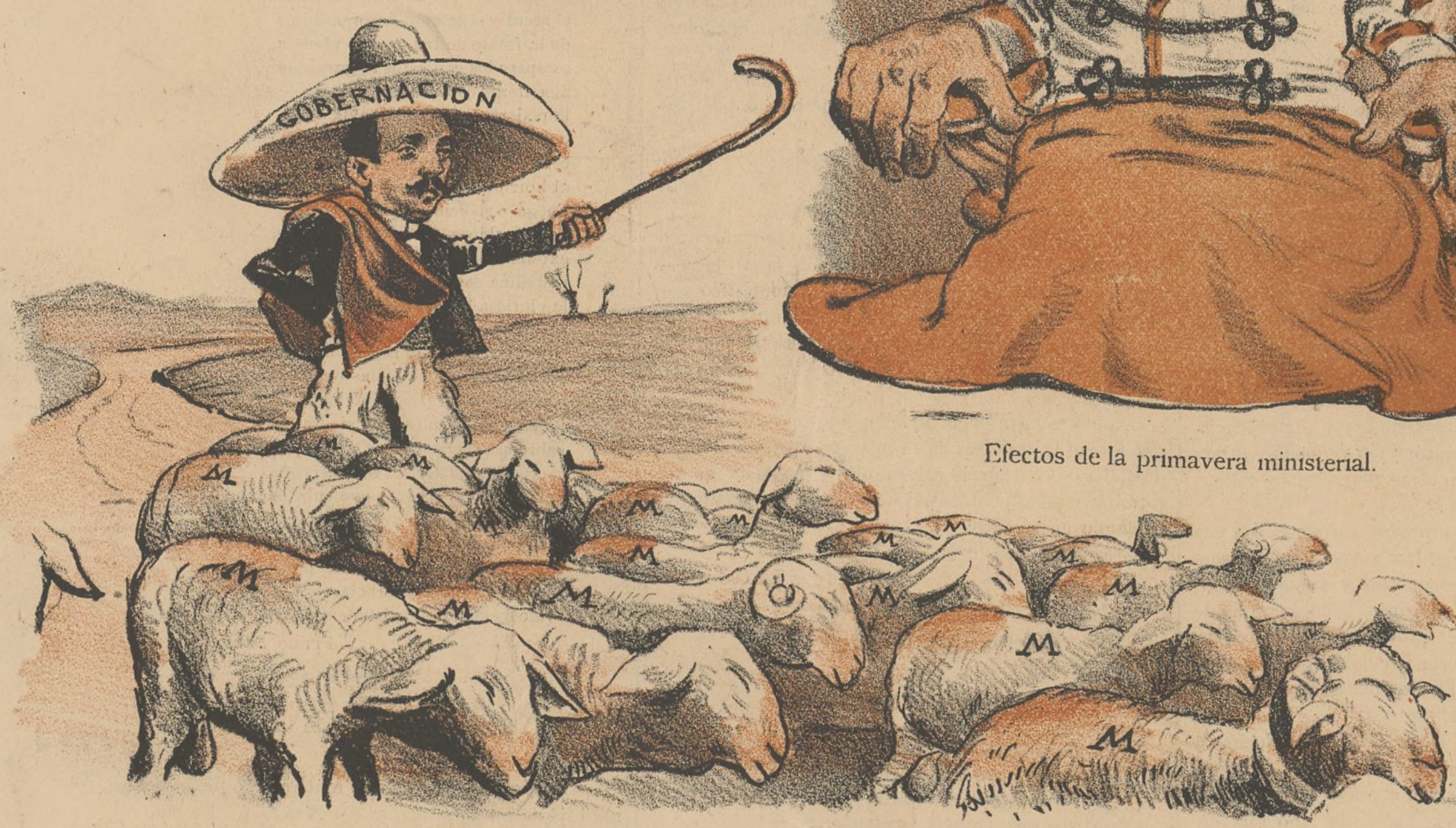
—No es mal rebaño el que hemos sacado de las urnas.