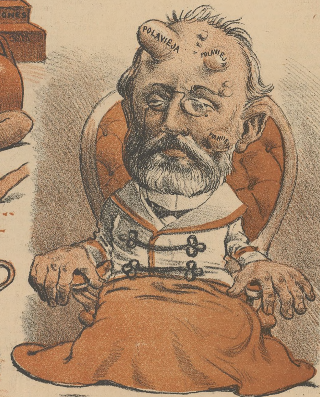
Efectos de la primavera ministerial.