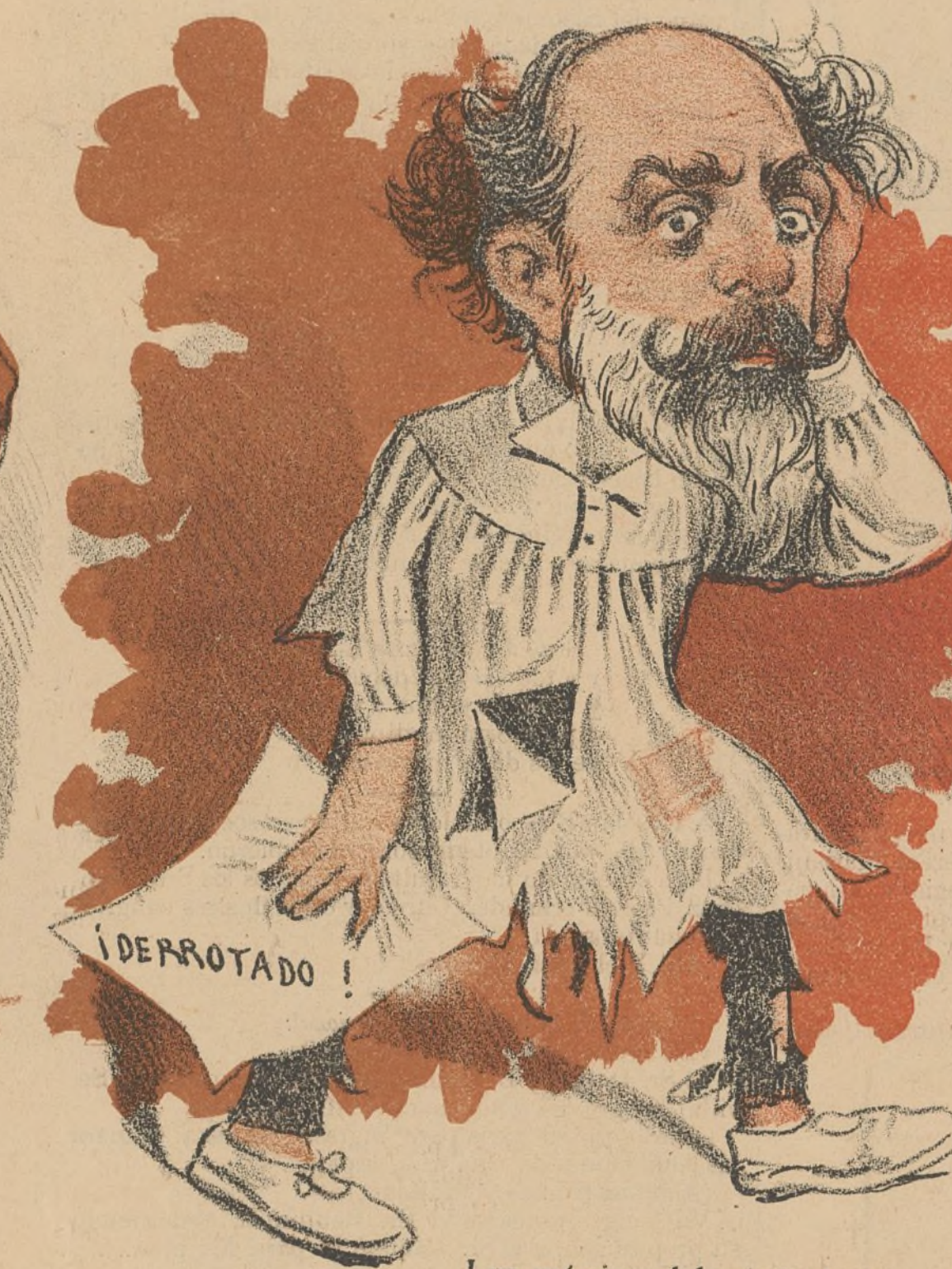
Los mártires del cristianismo.