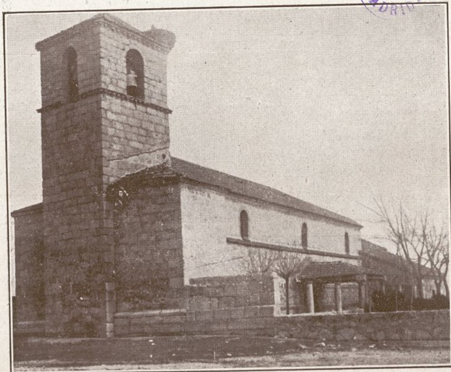
IGLESIA DE MORALARZAL