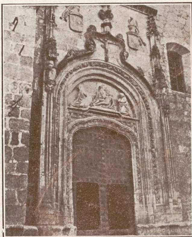
COLMENAR VIEJO Iglesia Parroquial. Puerta de la Lonja.