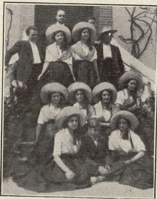
Miraflores de la Sierra —Lindísimas señoritas en el Coro de las Segadoras, de La Rosa del Azafrán. Siendo una verdadera lástima que nuestras efigies le hagan desmerecer. Rogamos a estas señoritas que nos perdonen.

Miraflores de la Sierra, 10 de mayo de 1933. C.