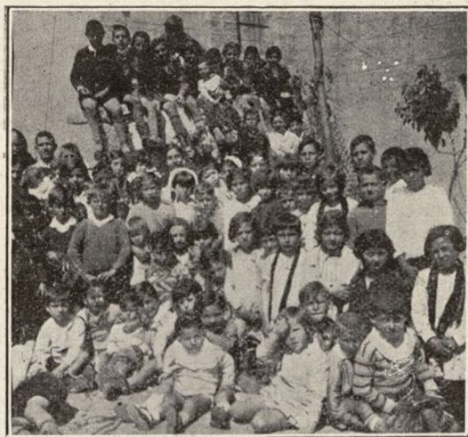
ESTACION DE VILLALBA. — Grupo de niños junto a nuestra administración