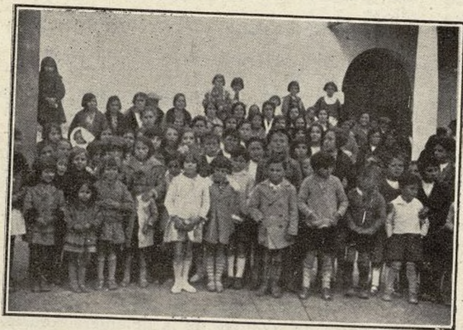
Chozas de la Sierra. Grupo de niños de la localidad.