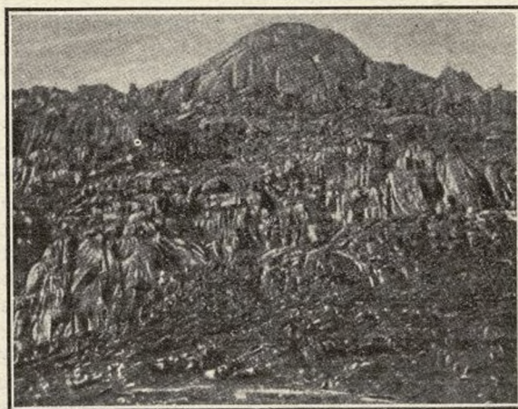
LA PEDRIZA.—Peña del Yelmo vista por el Suroeste.

La ermita de la Sacra tiene también su leyenda de bandolerismo, como otros lugares de la Pedriza que a continuación referiré.