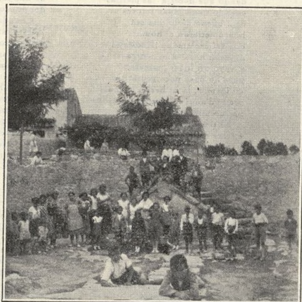
ALPEDRETE.—Fuente del pueblo

Esperamos que otra noche que tengamos el gusto de asistir, tengan ensayada la obra con bastante tiempo, pues en honor a la verdad hay elementos en ese cuadro artístico que pueden desempeñar sus papeles a la perfección.