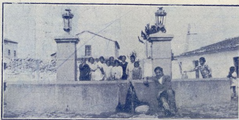
CHOZAS DE LA SIERRA Fuente de la Plaza.