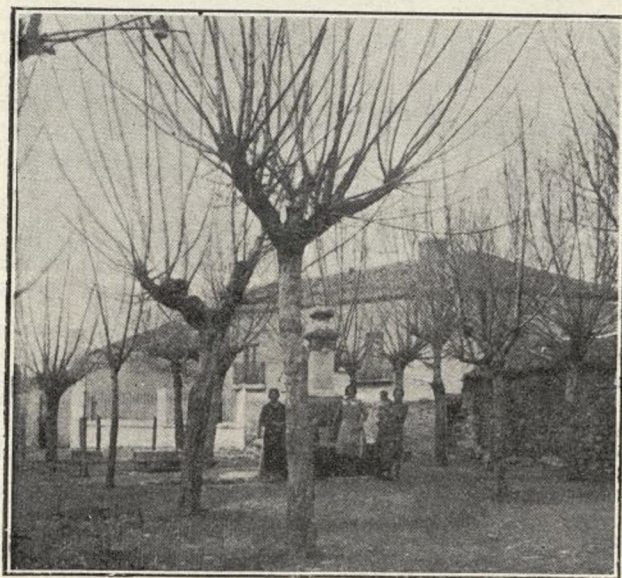
GUADALIX.—Fuente del pueblo.

Es en ganados donde se manifiesta de la manera más patente las inmejorables condiciones de los prados y fincas de su término, la mayoría terrenos de pasto, poseyendo una rica ganadería de ganado lechero, y pastando