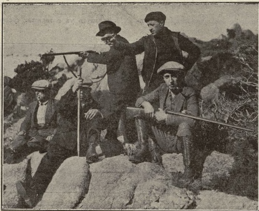
El puesto más avanzado en las cercanías de la Peña del Rayo, ocupado por periodistas, fotógrafos y prácticos, en espera de la fiera.

El plan de la batida se ha desarrollado por toda La Garganta, extendiéndose el reconocimiento por las vertientes de Las Guarramillas, Maliciosa y otras cumbres que forman el anfiteatro de La Pedriza. Hacemos omisión de reseñar el plan completo de la batida que organizamos con la ayuda de los prácticos de ésta, por haberlo ya publicado periódicos como «El Sol» y «Ahora», a los cuales nosotros hemos remitido.