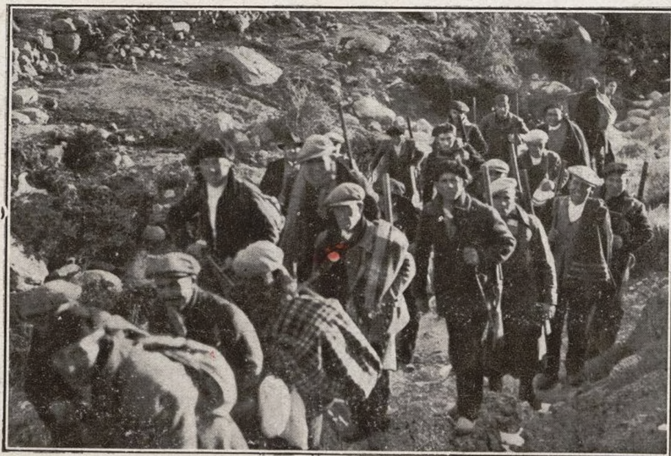
Los expedicionarios de Colmenar, marchando hacia sus puestos, en la batida efectuada el día 29 de Enero, en la Sierra