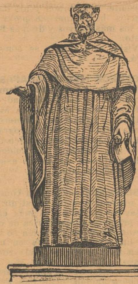
Estátua de Fray Luis de León que se halla situada frente a la puerta principal de la Universidad de Salamanca.