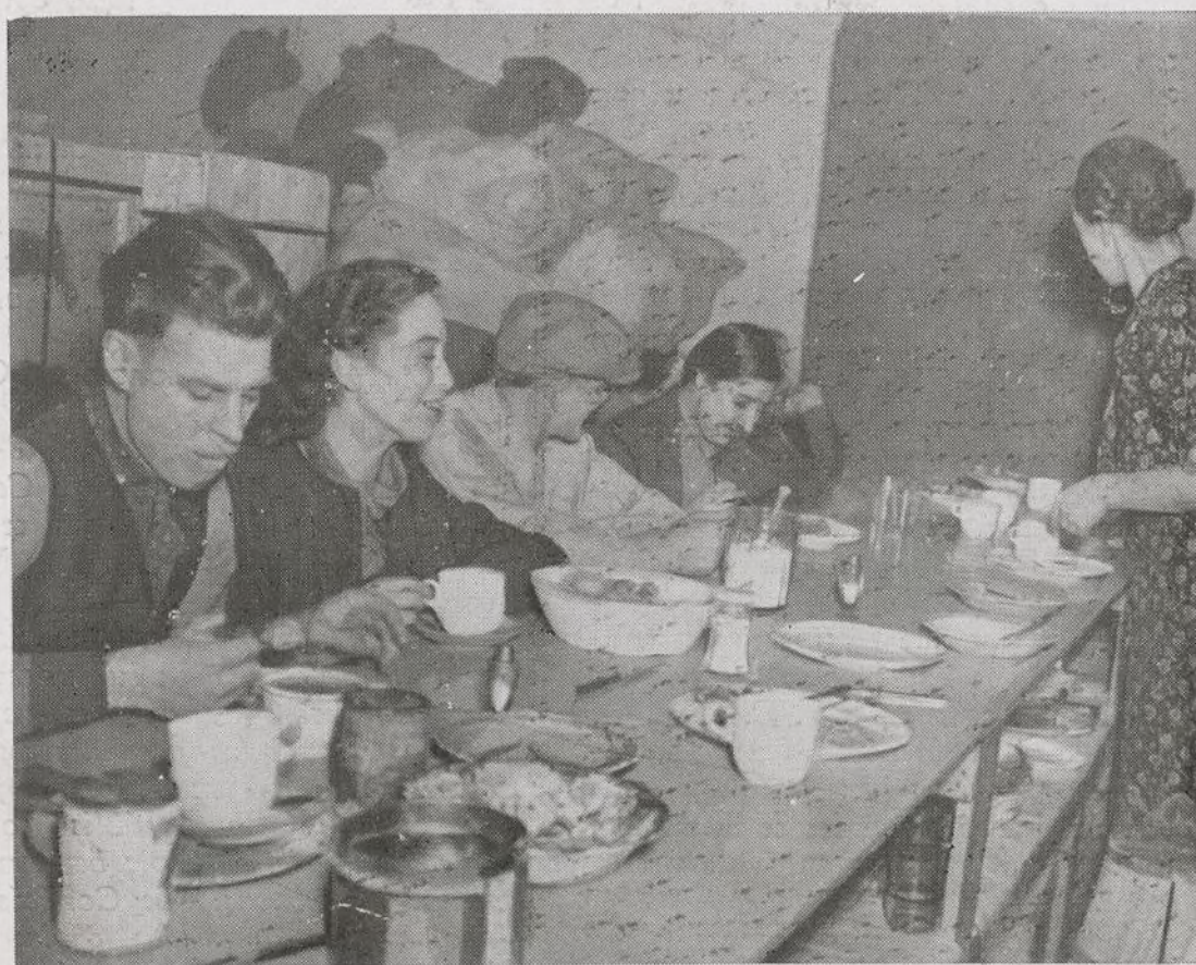
Obreros voluntarios comiendo entre fardos de mercancías preparadas para los leales de España, en un almacén de la ciudad de Nueva York, que sirve de depósito para los artículos que envían los simpatizantes americanos que forman el Comité norteamericano en favor de la democracia española.