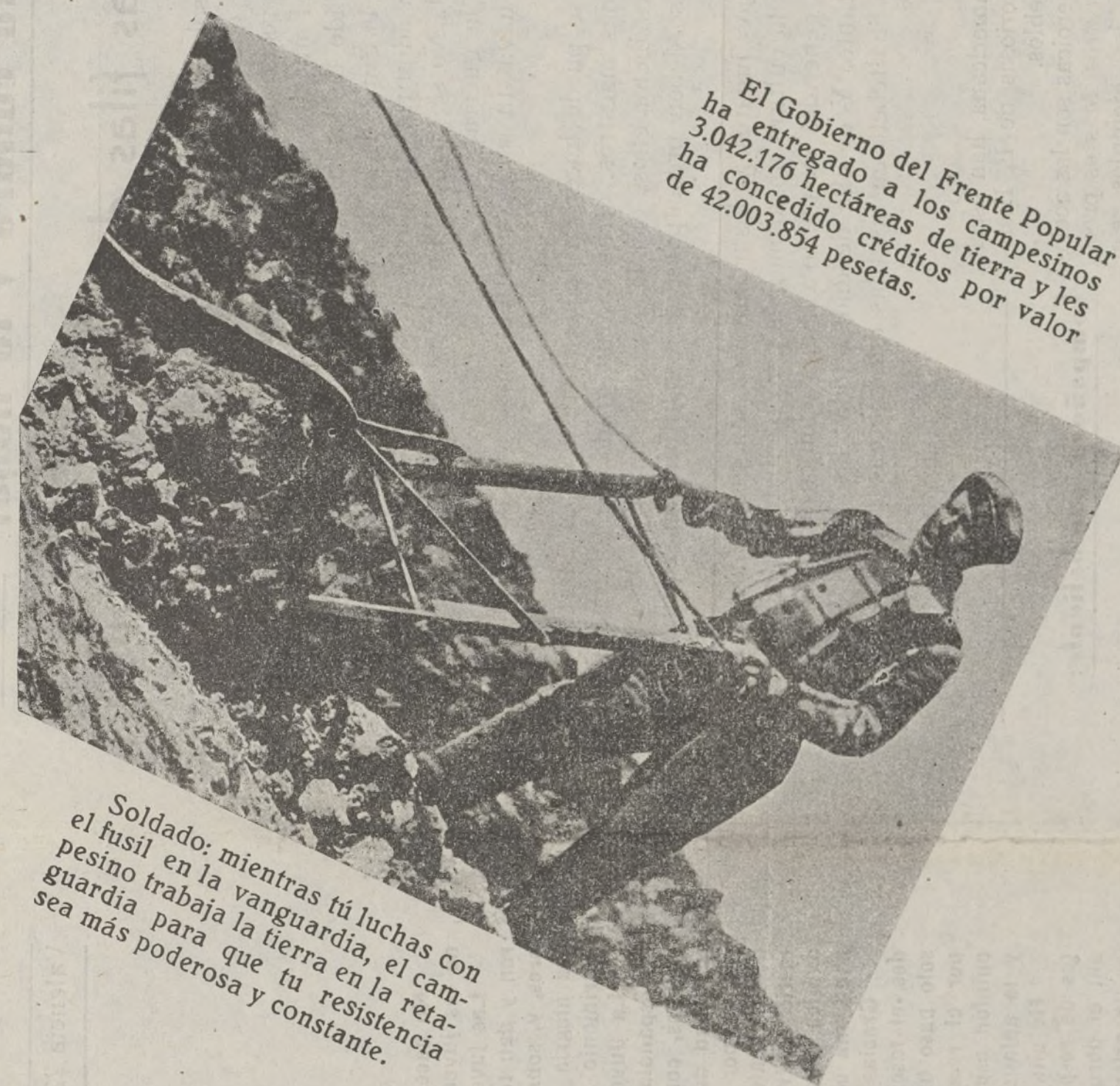
Soldado: mientras tú luchas con el fusil en la vanguardia, el campesino trabaja la tierra en la retaguardia para que tu resistencia sea más poderosa y constante.

Comisario Político del Batallón Villafranca