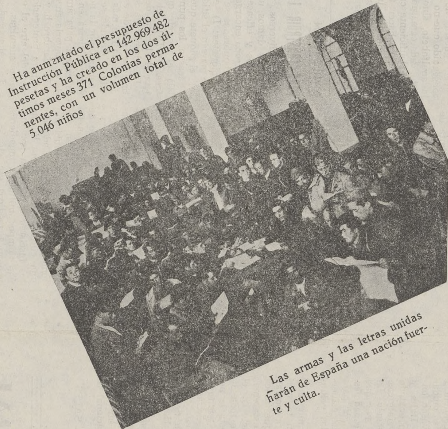
Las armas y las letras unidas harán de España una nación fuerte y culta.

Ha aumentado el presupuesto de Instrucción Pública en 142.969.482 pesetas y ha creado en los dos últimos meses 371 Colonias permanentes, con un volumen total de 5.046 niños