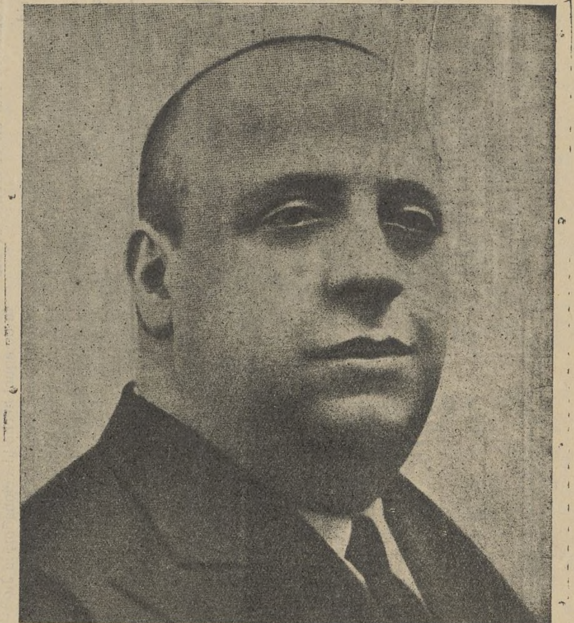
INDALECIO PRIETO Ministro de Defensa Nacional

El camarada Prieto que tantos éxitos cosechó en el anterior Gobierno, revalida en el nuevo gobierno sus dotes intelectuales y previsoras.