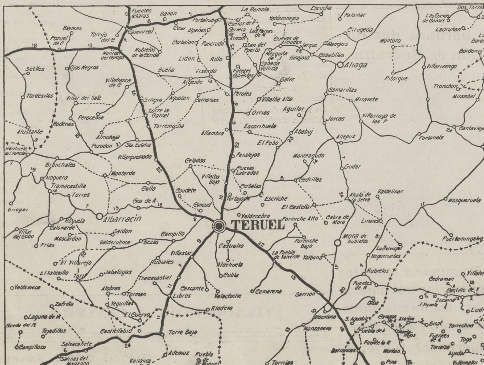
FRENTE DE TERUEL: Las armas gloriosas de la República van conquistando palmo a palmo el territorio nacional.

(Copia de un telegrama dirigido al comisario general en Valencia por el comisario de la octava División.)