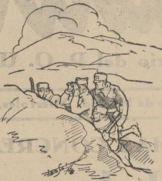
ESCENAS DEL FRENTE

Salvando, claro es, las alternativas que toda guerra tiene, podemos asegurar que no tardará mucho tiempo en que nuestra ofensiva nos lleve, como en volandas, hasta las últimas tierras extremeñas y andaluzas, donde esperan la liberación tantos y tantos de nuestros camaradas.