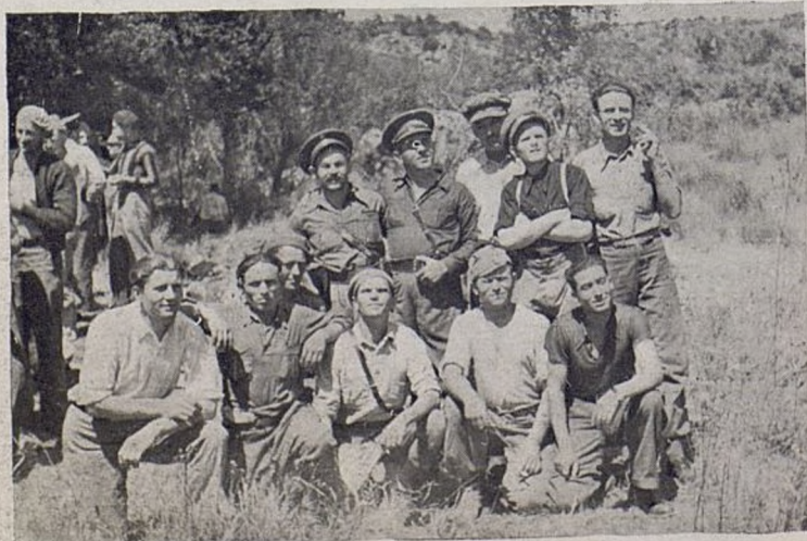
Grupa starih dimitrovaca.