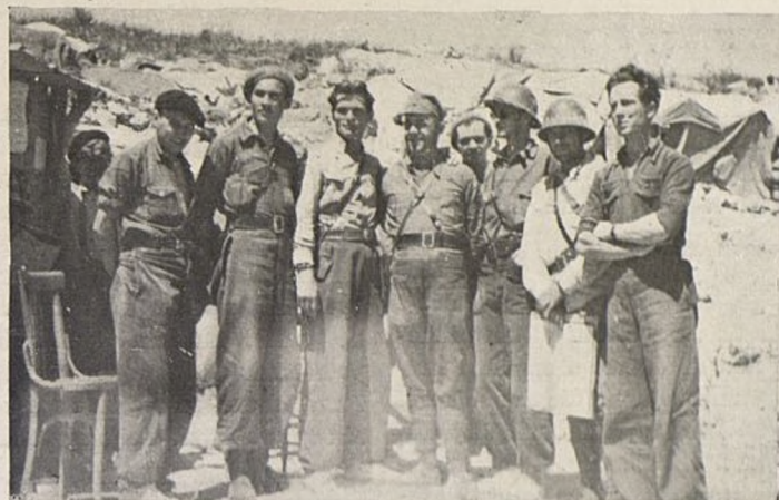
Estado Mayor del batallón «Dimitroff» Stab Bat. "Dimitrov".