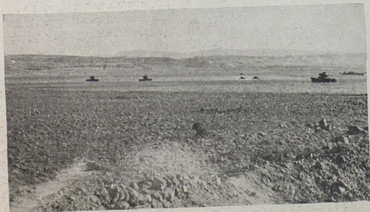
El ataque de nuestros tanques. Juris nasih tankova.