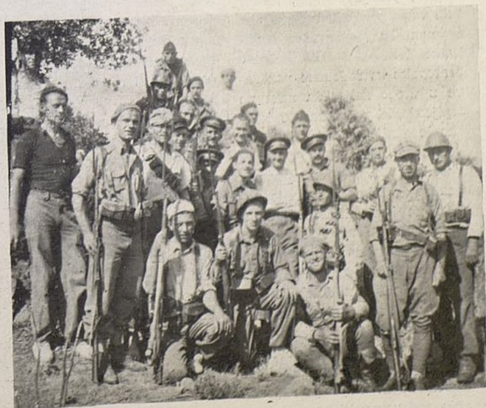
Grupa drugova Hrvata iz Bat. "Dimitrov".