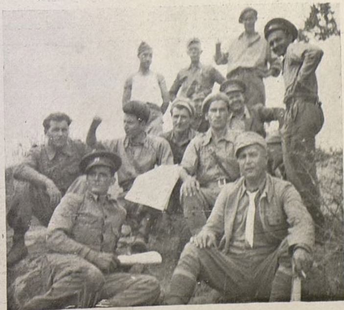
Dimitrovci — bígarskite drugari.