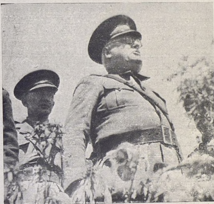
EL GENERAL MIAJA

El ejemplo del gran luchador antifascista lo han tenido siempre los "Dimitrovistas" ante sus ojos, cuando se lanzaron al ataque contra el enemigo y cuando contenían los ataques de las bandas fascistas. Esto ha unido a todos los "Dimitrovistas" compuestos de varias nacionalidades, y de varios movimientos políticos antifascistas. Todos "Dimitrovistas": españoles, croatas, serbios, checos, eslavos, eslovenos, búlgaros y montenegrinos, que, como todos, luchaban heroicamente contra los bárbaros fascistas, enemigos de la Libertad, de la Paz y de la Democracia. Los "Dimitrovistas" no pueden ser vencidos; ellos saben que luchan en España contra los invasores fascistas de Hitler y de Mussolini y también saben que luchan por la libertad y el pan de sus familiares, así como de todos los pueblos. Ellos saben lo que quieren y cómo hace falta luchar; por eso forman parte de una colectividad invencible.