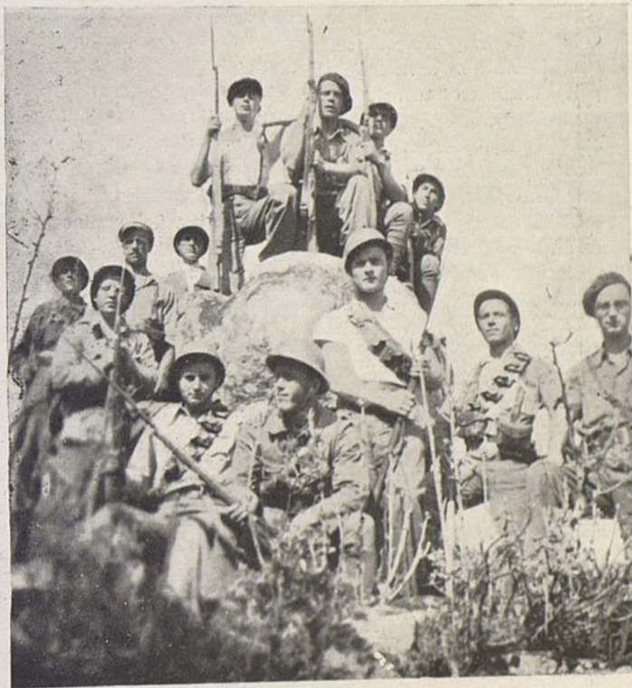
Sodrugci Slovenci iz I. cete, Bat. "Dimitrov".