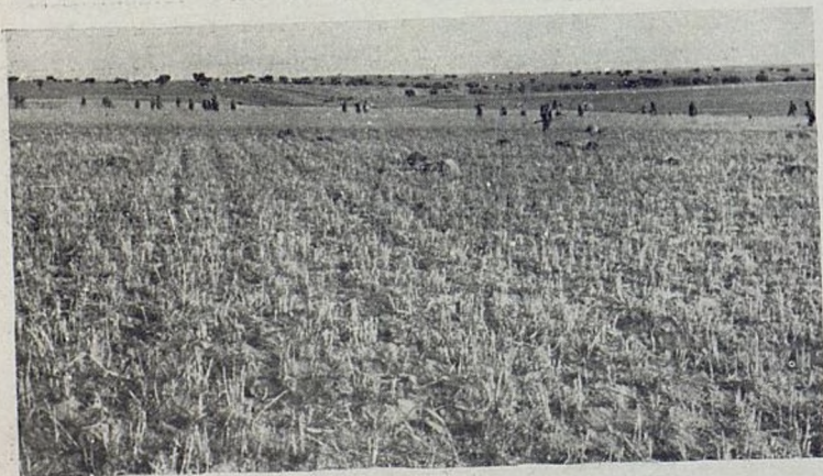
El Bat. "Dimitroff" en la ofensiva. Dimitrovci u ofanzivi.