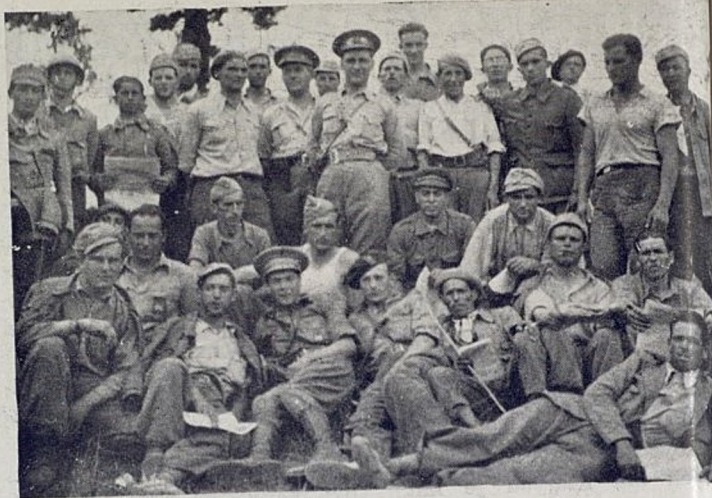
Camaradas españoles del Bat. "Dimitroff".