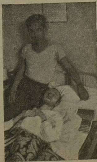
Drugovi Mioc i Janic na putu ozdravljenja

Drug Vukasin Radunovic hrabro je poginuo, nekoliko dana poslije, prilikom zauzeca Belchita.