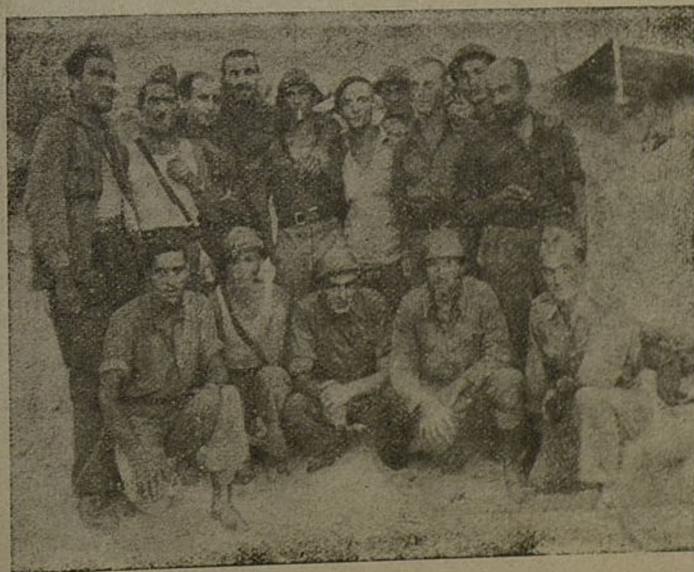
Grupa nasih boraca baterije "P. MILETIC"

Dovrovoljci 3 Batreije Slavonske artiljerijske grupe imena. "KOLAREVOG"