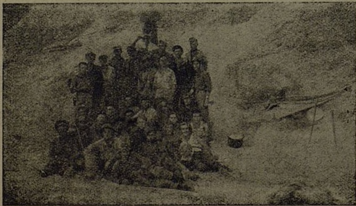
Grupa drugova iz baterije «Miletic» i bat. «Djakovic».