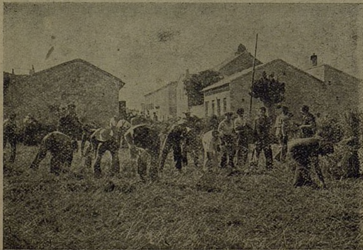
Udar na brigadu za vrijeme rada

MATIJA VIDA KOVIC Tvoj drug sa robije i fronta.