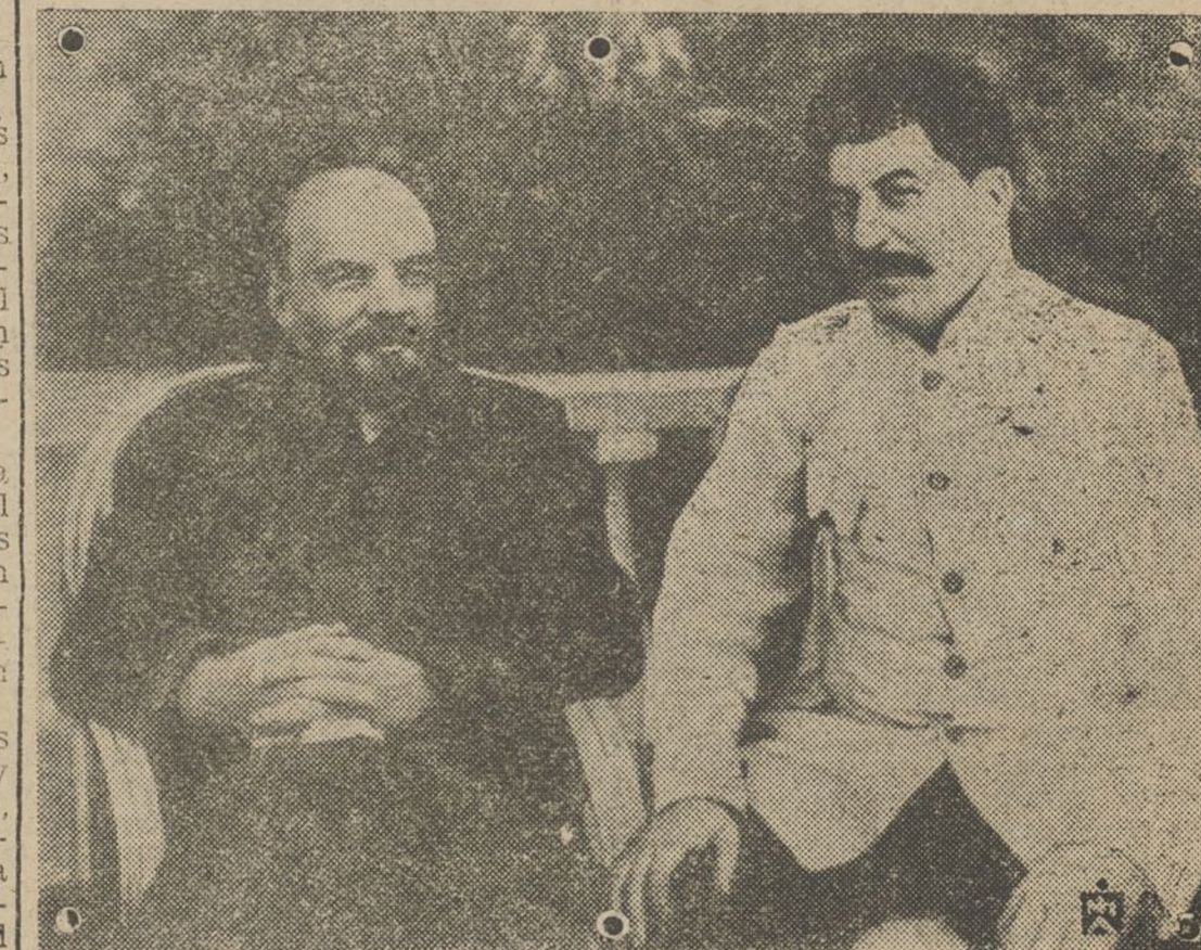
LENIN Y STALIN EN LOS PRIMEROS MOMENTOS DE LA REVOLUCION RUSA

retaguardia, para facilitar la labor y el triunfo de la República. necesidad de abrir las puertas para que vayan saliendo todos aquellos Vamos a realizar el esfuerzo sobrehumano, vamos a incorporar una vez más a la lucha, vemos la compañeros que de un momento a otro han de incorporarse porque le exige la guerra.