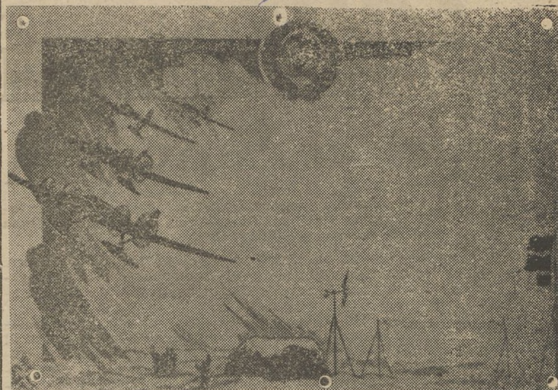
LOS AVIONES SOVIETICOS EVOLUCIONANDO SOBRE EL CAMPAMENTO DE LOS CONQUISTADORES DEL POLO, PAPANIN Y SUS CAMARADAS

des, es norte y guía, esperanza de la masas enteras del planeta, de los trabajadores, obreros y campe-