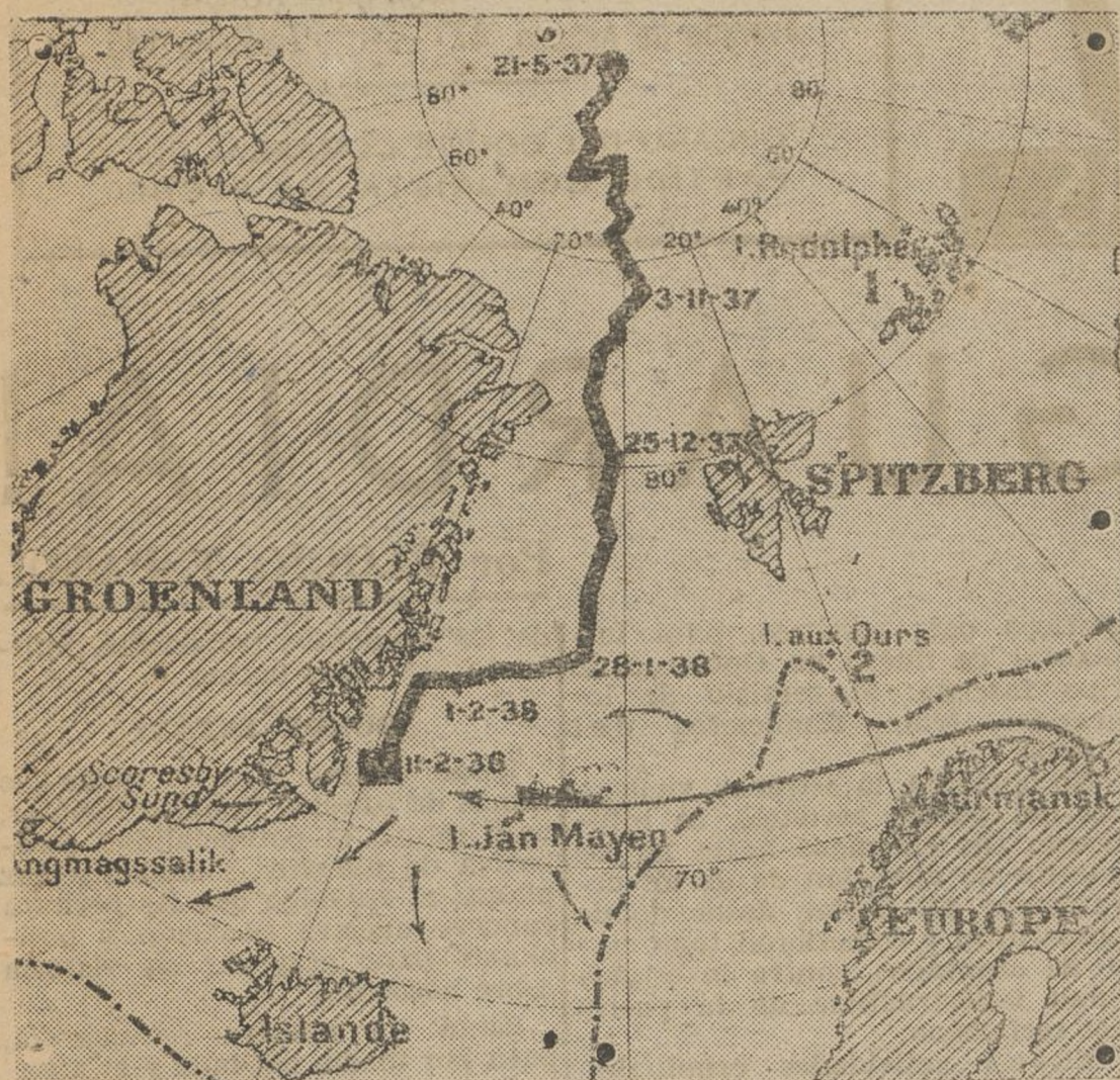
RECORRIDO DEL BANCO A LA DERIVA

Los éxitos científicos alcanzados por la expedición Papanin des-