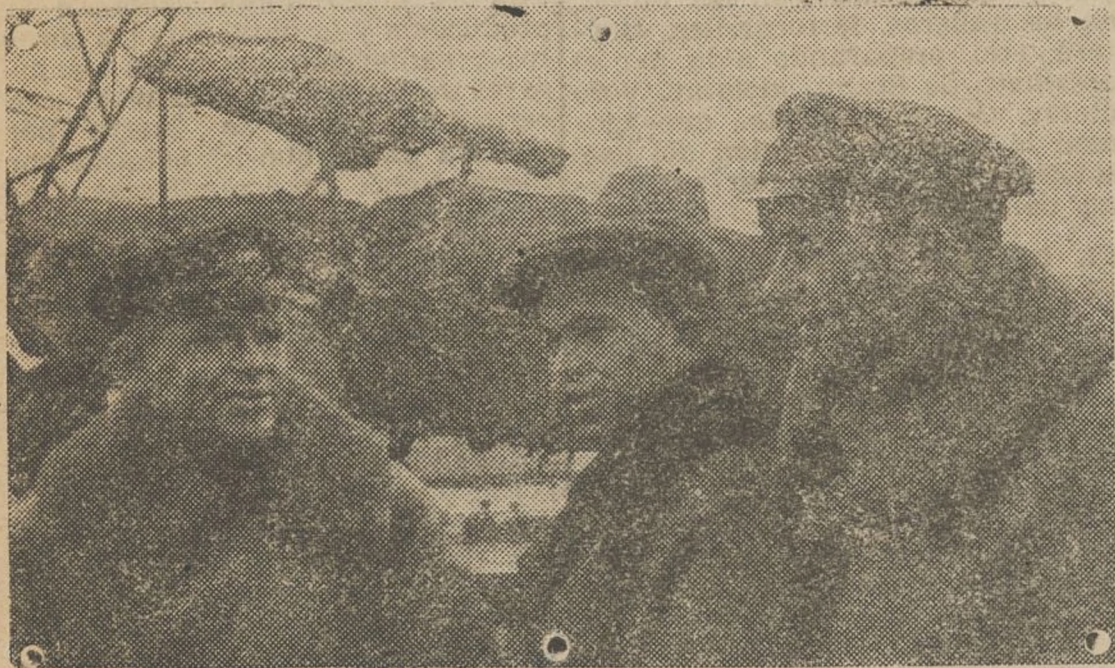
EL AVIADOR VLASOV Y SUS CAMARADAS QUE SALVARON LA EXPEDICION

pués de conquistar el Polo, suponen las artes, en la industria, en la otras tantas conquistas para la vida y en la felicidad de los hom-