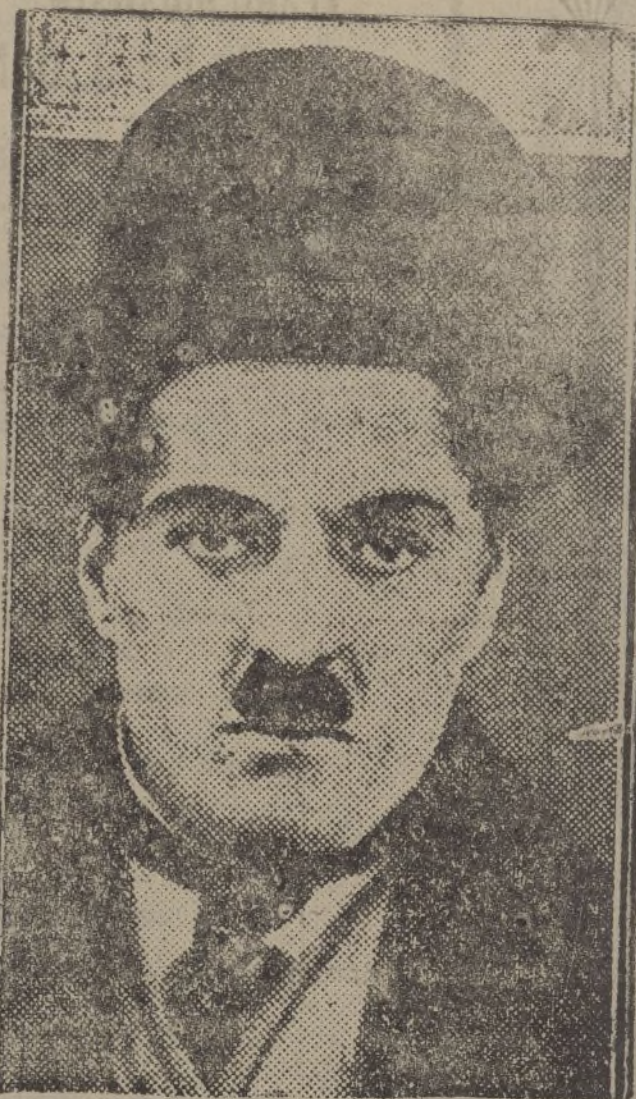
Charles Chaplin (Charlot) tal como se nos muestra en la pantalla

Si en un mañana próximo las democracias occidentales necesitan verter lágrimas por una situación bélica se dirá, y con razón, que esto pudo evitarse y aquellas lágrimas serán entonces conceptuadas como lágrimas de cocodrilo.