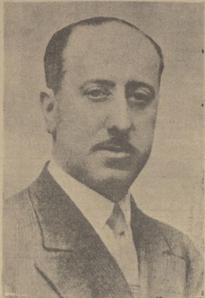
El ingeniero industrial don Manuel Casanova y Conderana, ex director general de Industrias y actual presidente del Instituto de Ingenieros Civiles, que ha representado muy brillantemente a España en el Congreso Internacional de la Fundación, celebrado en Bruselas.