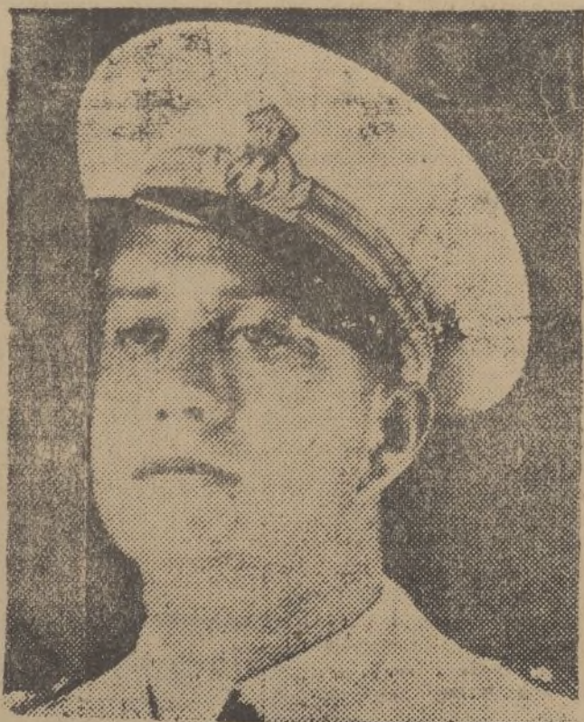
El conde Galeazzo, yerno de Mussolini, manda en Eritrea—a donde marchó voluntario—la escuadrilla «Disperata», distinguida ya en muchos hechos de guerra.