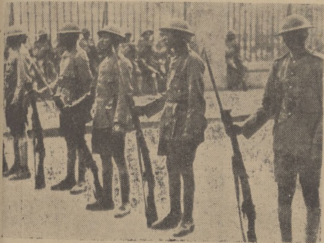
Tropas egipcias prevenidas para sofocar cualquier desorden que pueda producirse como consecuencia del movimiento nacionalista en aquel país.