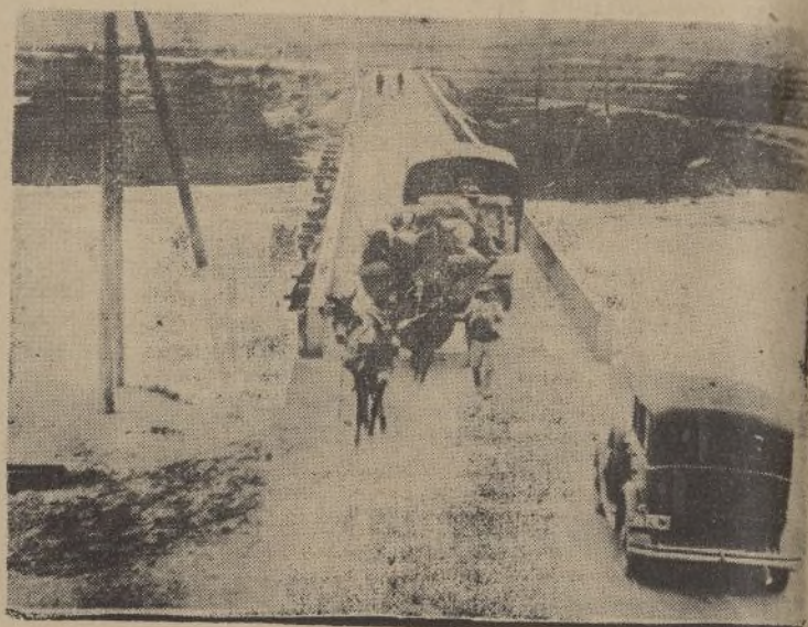
A partir del día 1.º de Diciembre el tráfico rodado por el puente queda limitado a 2.000 kilos. En este caso, del carro y del camión que vemos en este cliché, tendrán que ser descargados y transportada la mercancía en varias veces.

Insistimos, porque nada hemos dicho ni queremos decir en contra, en que la denuncia y la medida adoptada por la Jefatura de Obras Públicas son convenientes y si se quiere hasta