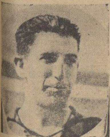
Medio ala: Pelayo.

Gimnástico-Elche, R. Granada-Mirandilla, Murcia-Malacitano y Xerez-Levante.