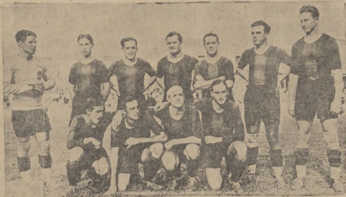
El «Barcelona F. C.», que el pasado domingo derrotó al «Valencia F. C.» en su campo por 2 «goals» a 1