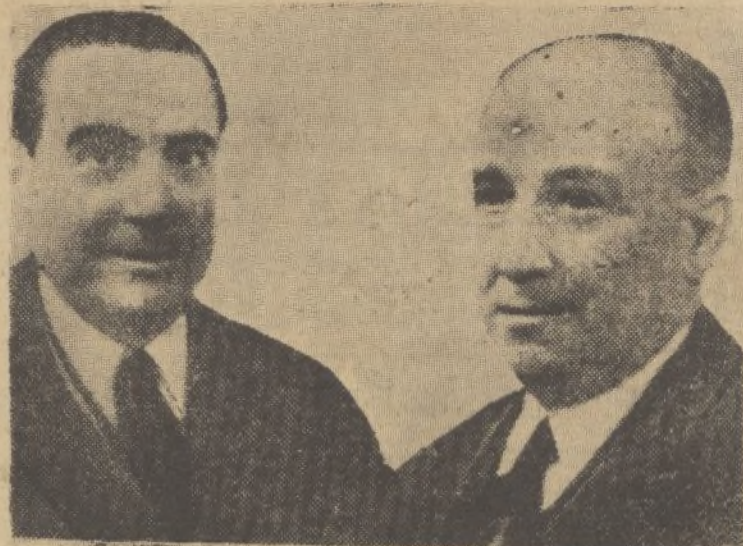
El exministro socialista, don Francisco Largo Caballero, con su abogado defensor don Luis Jiménez de Asúa.

—¿Quién es ese señor a quien todo el mundo saluda? —Algun notable? —Nada de eso. Es el jefe de la Policía secreta. (De "Sttebello".)