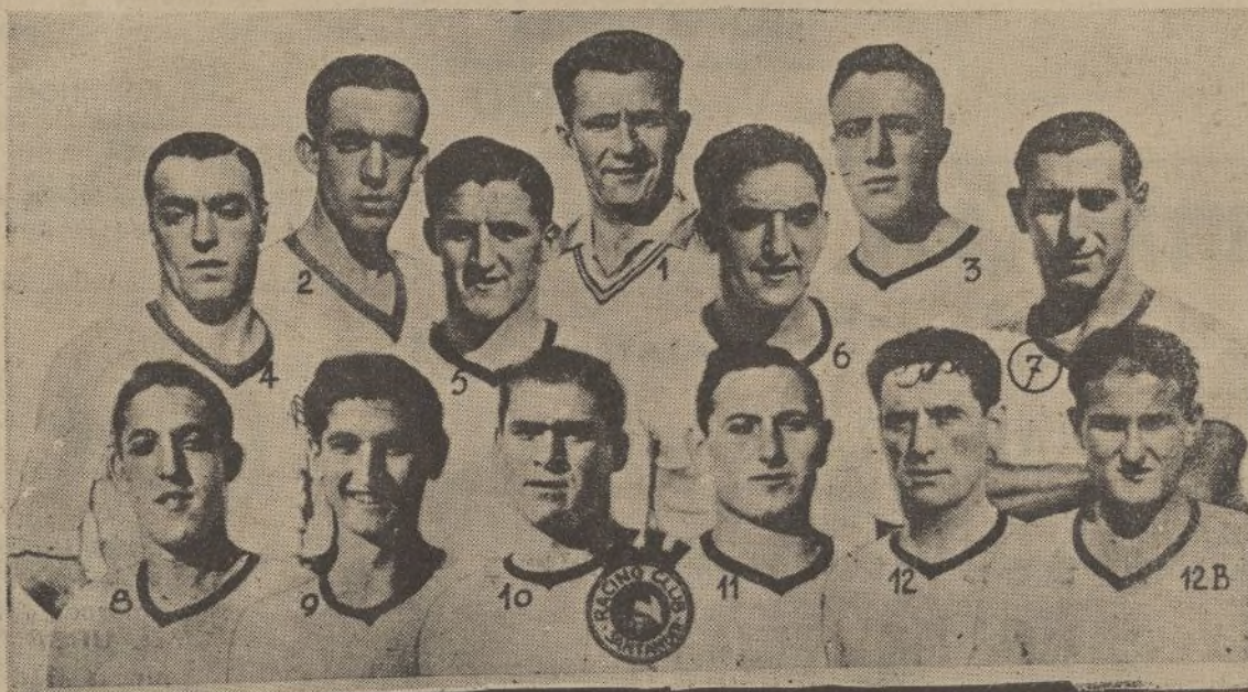
El «Racing» de Santander, que el domingo venció al «Sevilla»

Comerciantes, Industriales, La casa mejor surtida en artículos de escritorio