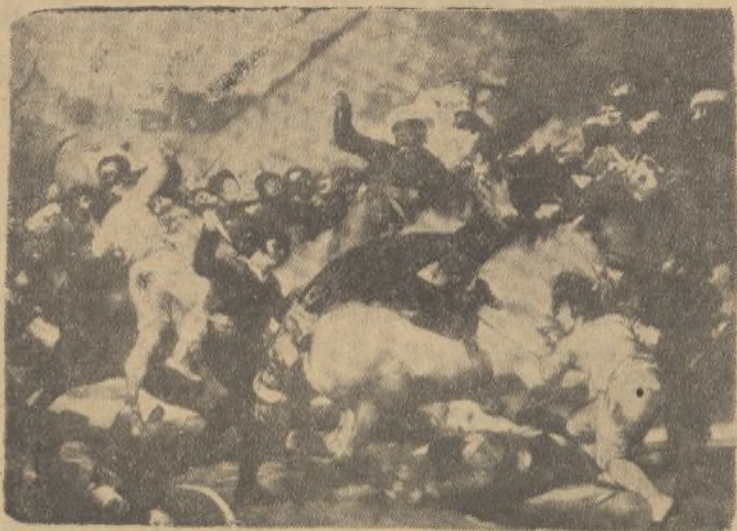
La carga de los Mamelucos en la Puerta del Sol. (Museo del Prado, Madrid)