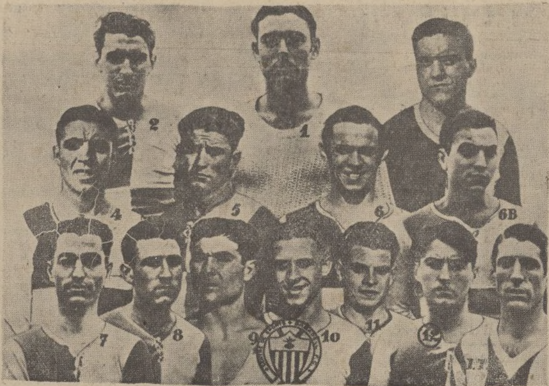
Equipo del «Sabadell F. C.», subcampeón de España, que mañana contendrá en partido de Liga con el «Baracaldo»