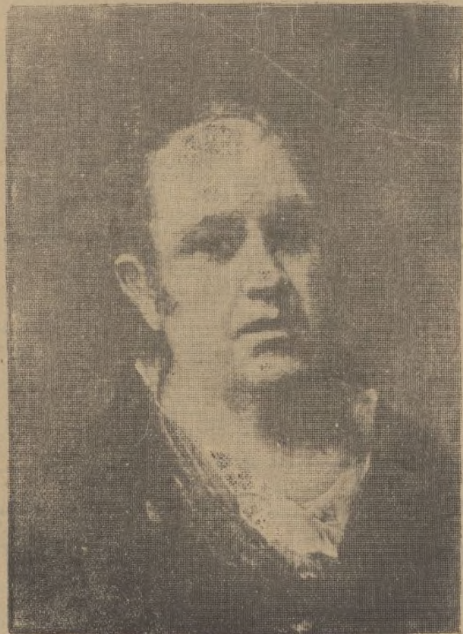
Autorretrato del insigne pintor que se conserva en el Museo del Prado de Madrid.

do los elevados precios que, naturalmente, suelen tener esas publicaciones.