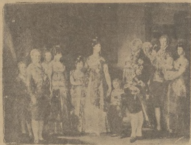
La Familia de Carlos IV (año 1800).