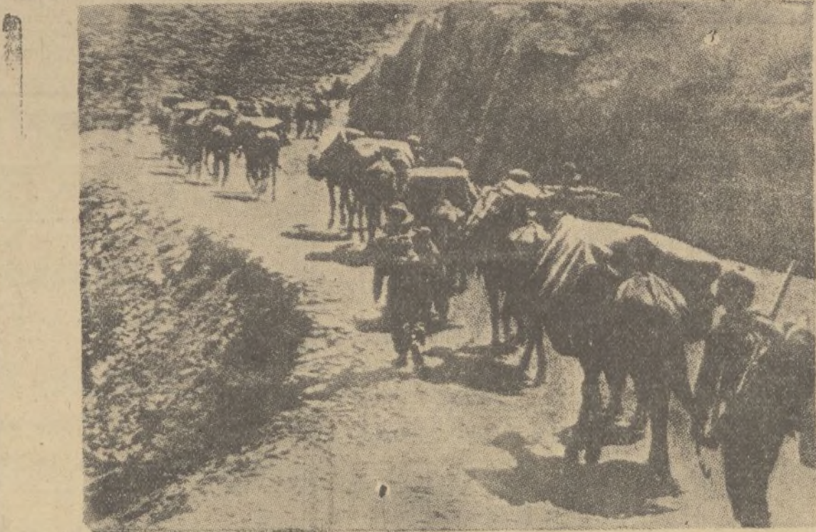
Un convoy de municiones recorre por primera vez una carretera recién construida que lleva a las regiones altas del Tigré, conquistadas por las fuerzas italianas.