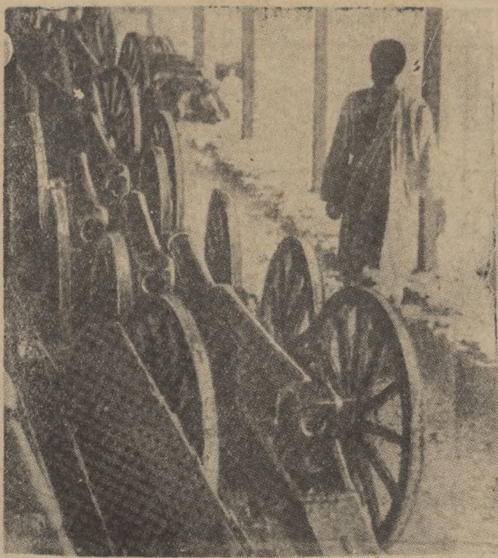
Los 17 cañones cogidos a los italianos por los abisinios en la acción de Adua en 1896 y que se conserva en el Palacio Real del Negus