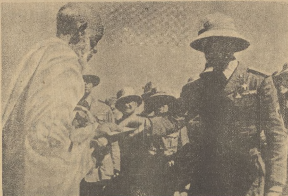
El duque de Bergamo, primo del rey de Italia, recibe la sumisión de un notable en Adi-Ugri