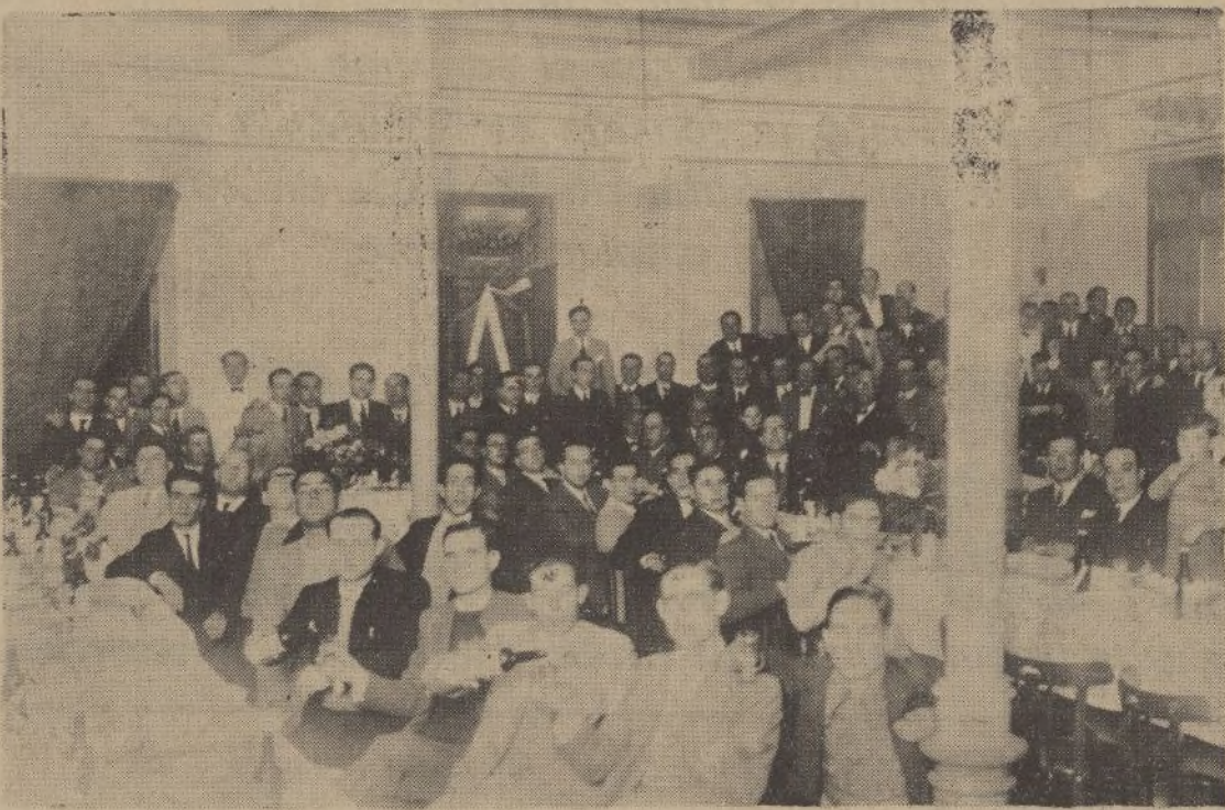
Autoridades y asistentes al homenaje celebrado en honor del presidente del Orfeón Onubense.