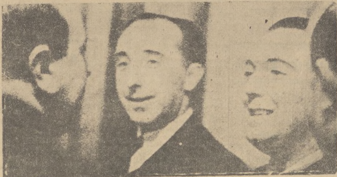
El señor Gil Robles con el señor Rey Mora y otros diputados conversan animadamente en los pasillos del Congreso.