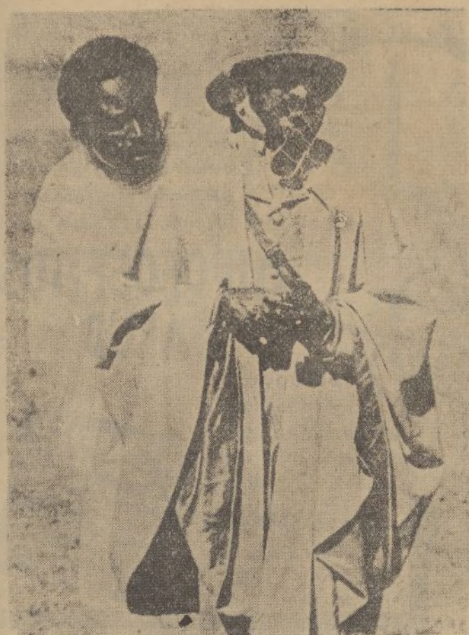
El emperador Haile Selassie antes de salir en avión para Harrar y Jijiga