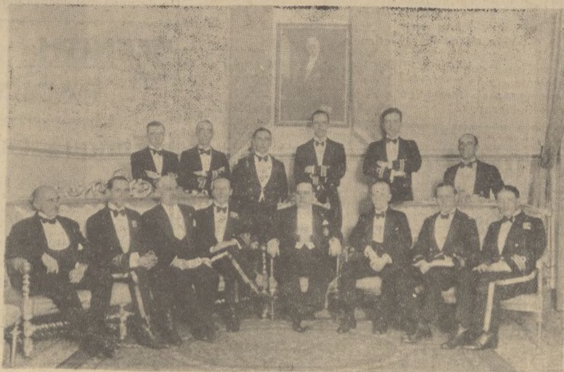
El gobernador señor Fernaud, con los jefes y oficiales de los «destroyers» ingleses, cañonero español «Laya» y otros invitados, después de la comida íntima celebrada anteanoche en el Gobierno civil.

Nuestra felicitación al letrado defensor.