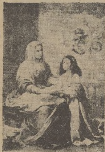
Santa Ana dando lección a la Virgen. (Museo del Prado)

Siguiendo el plan trazado en nuestra anterior página de «Divulgaciones sobre el arte en España», pensábamos hoy invertir nuestra jornada en una insignie figura de la escultura, pero reciente aún la fiesta de la Purísima Concepción, hemos querido dedicar en su honor este humilde trabajo y para ello nada mejor que ocuparnos de