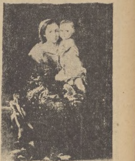
La Virgen del Rosario (Museo del Prado)

Ya en épocas mas modernas figuran entre los biógrafos principales del pintor de la Virgen, «Davies», inglés en 1819, Thoré en 1835, Stirling, inglés, en 1848, Strome, alemán en 1879, Minor y Curtis en 1882 y 1883, Alfonso, español en 1886, Lefort, francés en 1892, Maxwell in-