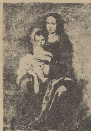
La Virgen y el Niño. (Museo del Prado)