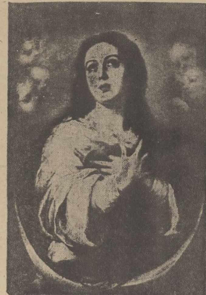
Otra Purísima Concepción.

La invasión francesa no sólo nos dejó triste recuerdo en lo que con la gran figura de Murillo se relaciona, por las obras de arte que perdimos debidas a su firma, sino que, para mayor desgracia, hasta nos arrasó la iglesia donde yacían los restos del inmortal genio, y como recuerdo de este sagrado lugar, en la historia de las grandes figuras de la Patria, hay una lápida en una de las fachadas del solar donde existió la Iglesia de Santa Cruz, hoy plaza del mismo nombre, cuya inscripción es la siguiente: