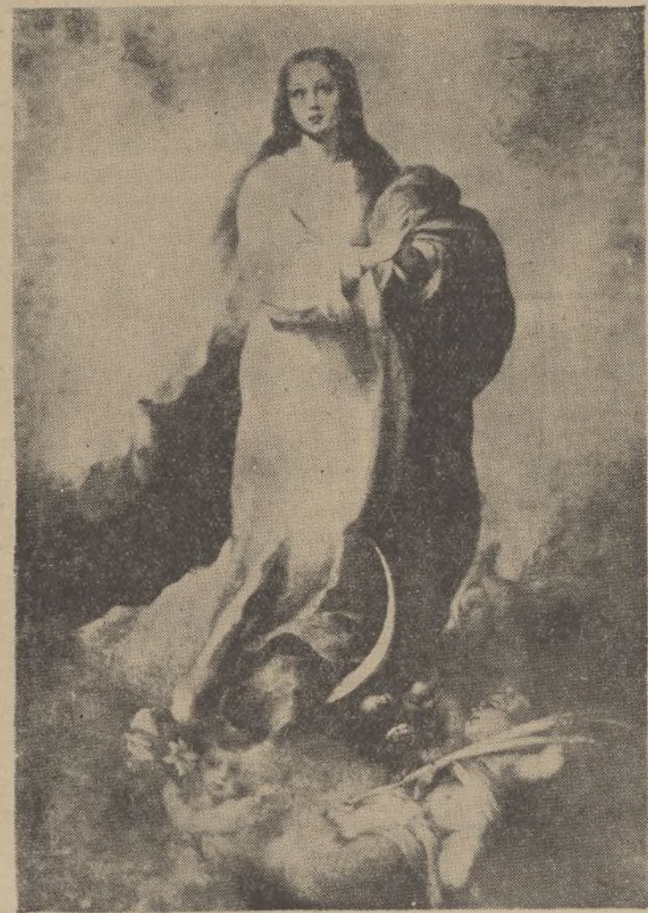
La Purísima Concepción.

Llegado a la Corte en 1642 visitó a su paisano, el ya entonces célebre maestro Diego Velázquez, quien le dió fácil acceso a las colecciones reales que atesoraban selectos ejem-