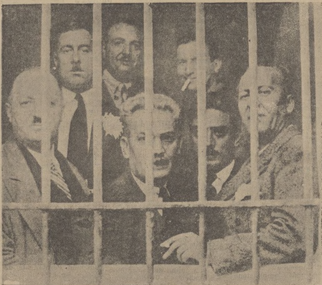
Los políticos griegos condenados por la revolución de Marzo han sido puestos en libertad, en virtud de la amnistía. En la foto, el expresidente del Senado, M. Ponotos, rodeado de otros presos políticos, momentos antes de abandonar la prisión de Oropo, a unos cien kilómetros de Atenas.