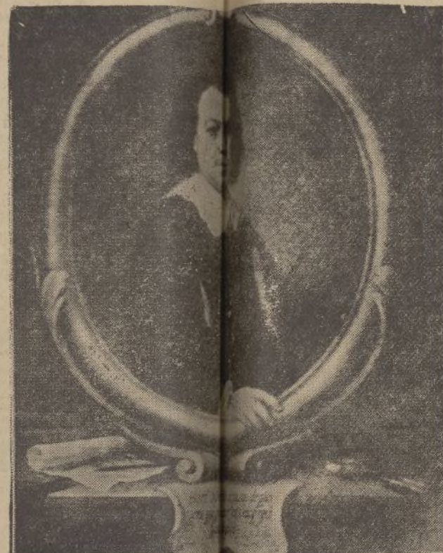
Autorretrato de Bartolomé Esteban Murillo. (Colección SPENCER de Londres)

En el Museo Provincial, de Sevilla, se hallan expuestas 24 obras de este genial artista, aun que dos de ellas son de dudosa autenticidad, que representan «Una Virgen sentada con el niño» y una «Concepción», figurando, entre otras, las siguientes, cuyos números corresponden al Catálogo de don José Gestoso: «San Antonio», núm. 78. «Santas Justa y Rufina», número 81. «San Agustín», número 84 y 87. otra «Concepción», número, 88. «Santo Tomás de Villanueva», núm. 90. «La Concepción», llamada «La Grande», núm. 91. «La visión de