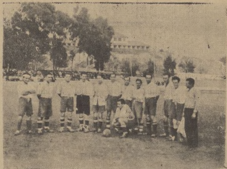
Equipo del «Titan F. C.» que el domingo se enfrentó con el «Libertad F. C.»

Es una costumbre muy frecuente en otros países europeos el organizar dos partidos internacionales simultáneamente. Así veremos, por ejemplo, que el día que se disputa un partido Austria-Italia en Viena, las selecciones «B» de ambas naciones juegan otro encuentro en terreno italiano. Esta doble organización internacional la practican con frecuencia, además de los dos países citados, Francia, Bélgica, Hungría, Checoslovaquia, Alemania, Suiza, Holanda, etc., y no cabe duda de que revela ante el mundo deportivo una potencialidad deportiva muy significativa. España, potencia futbolística de primer orden, ¿no es capaz de realizar análogo alarde? ¿Es que mientras nuestro