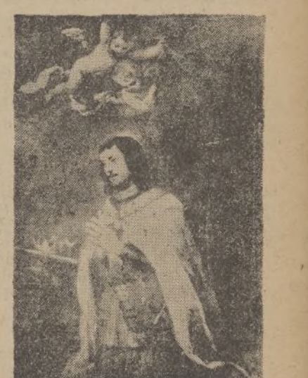
San Fernando Rey de España (Museo del Prado)

En 1683, Sandrat publica una biografía de Murillo, pero la primera que se hizo en España fué la de «Palomino» publicada en 1723 en el «Museo Pictórico». Esta biografía fué traducida al inglés en 1739 y al francés