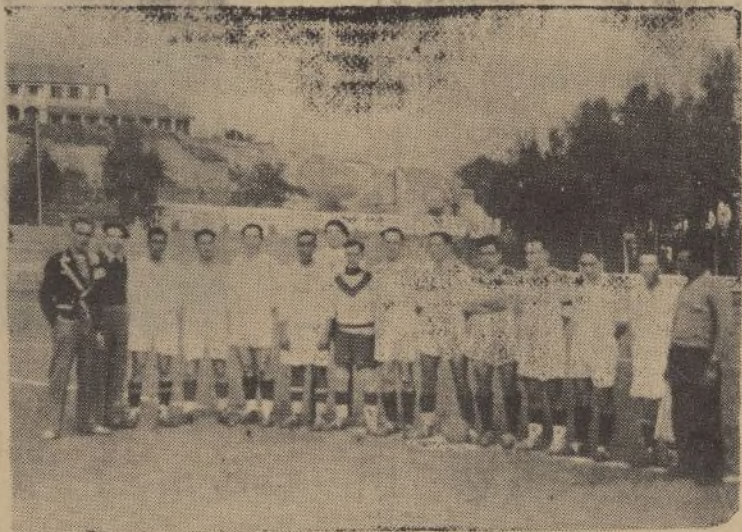
Equipo del «Libertad» que venció al «Titán» el domingo por cuatro goles a uno