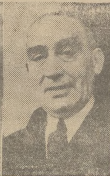
M. de Velasco (Estado)