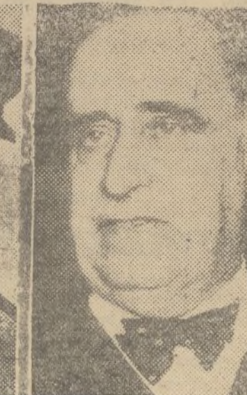
Almirante Salas (Marina)