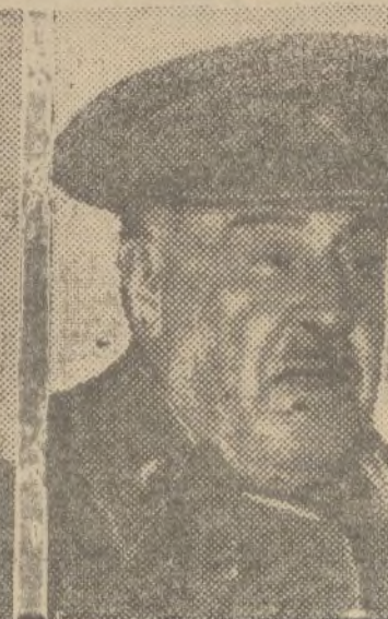
General Molero (Guerra)