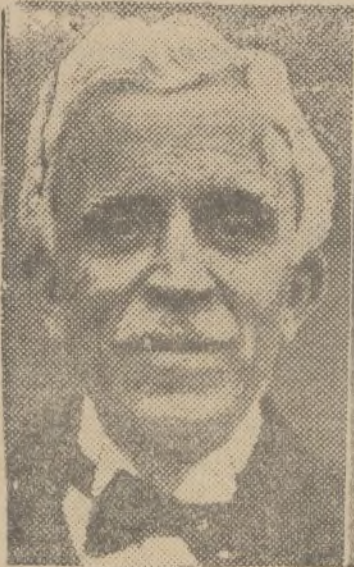
Portela Valladares (Presidencia y Gobernación)