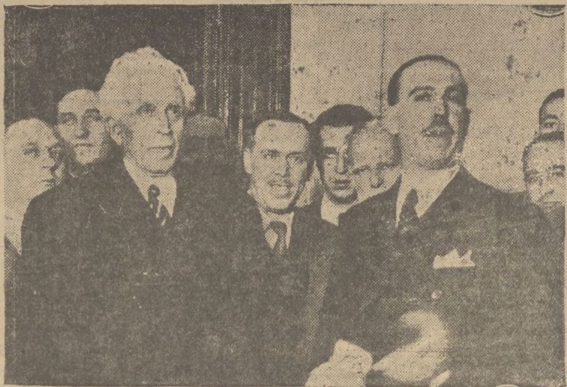
El ministro de la Gobernación señor De Pablo Blanco, después de dar posesión del ministerio al señor Portela Valladares, jefe del nuevo Gobierno