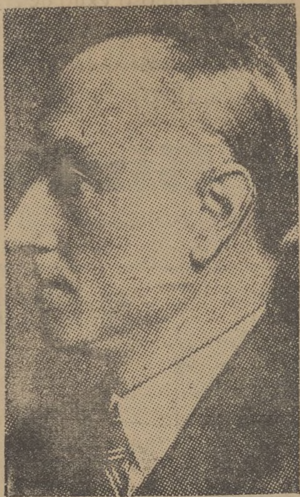
En Londres ha dimitido el ministro de Negocios Extranjeros sir Samuel Hoare