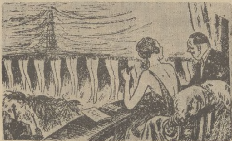
La mujer.—¿Qué pasa en el telón, que no baja?

A la salida que se afectuó con todo orden, se hizo una colecta en favor de los presos políticos y sociales.