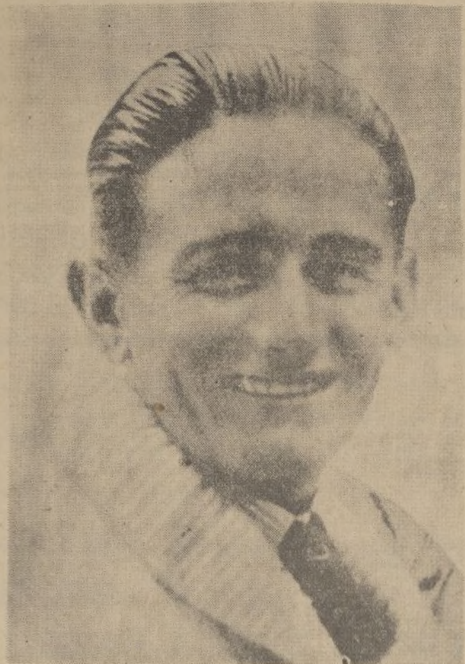
Vicente Trueba es el primer invitado de los españoles para participar en la próxima Vuelta a Francia.

po o para el conglomerado. Monsieur Desgrange ha aprendido mucho con la «defaillance» de los Cañardo, Trueba, etcétera, el año pasado y está dispuesto a que todos rindan a medida de sus fuerzas.