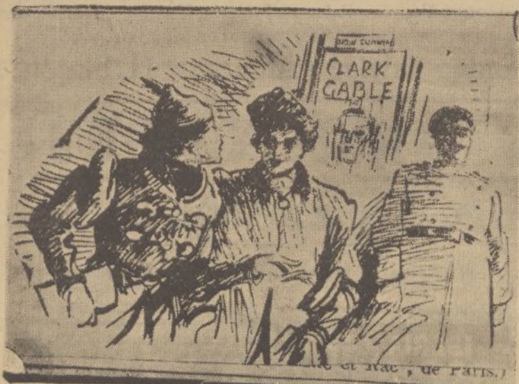
—¿Clark Gable? Vámonos a otro cine. No quiero verle. Le llevo escrita más de veinte cartas, y el muy grosero no me contesta. (De «Humorist», de Londres.)