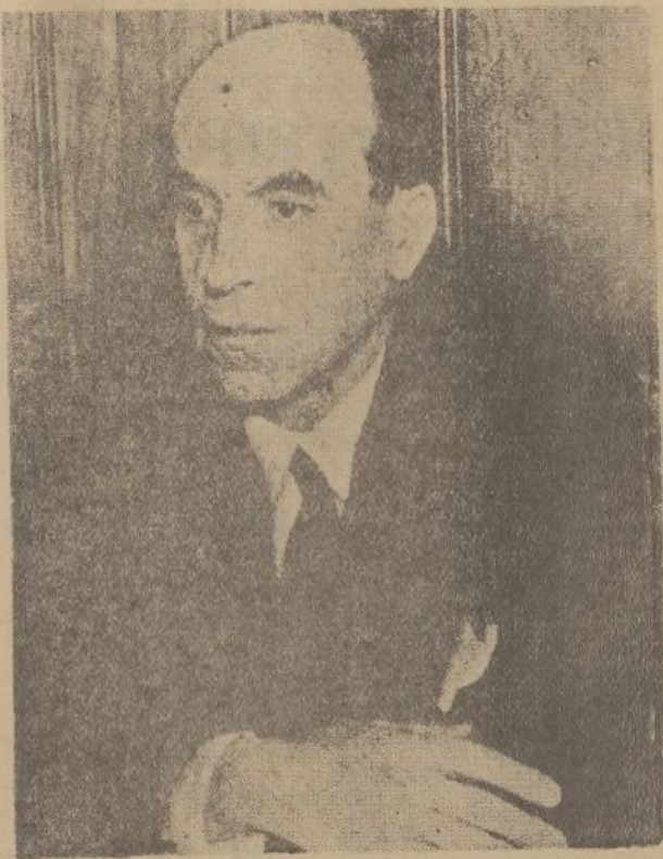
Don Ramón Goll y Rodés, nuevo alcalde de Barcelona

«Astra», con los más bonitos modelos (invierno 1936), 6'50 ptas.