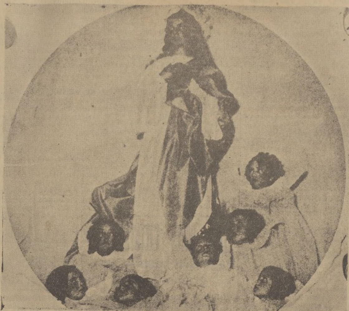
Mejoraría el pincel del divino Murillo esta Inmaculada, con sus angelitos, cuya alegoría ha sido representada, en cuadro plásico, por niños de distinguidas familias valencianas que han tomado parte en una función benéfica?

caciones sobre la tramitación de la solicitud que se discute y dice que cree es llegado el momento de reglamentar el servicio, pidiendo votación para rechazar o no el dictamen de la Comisión.