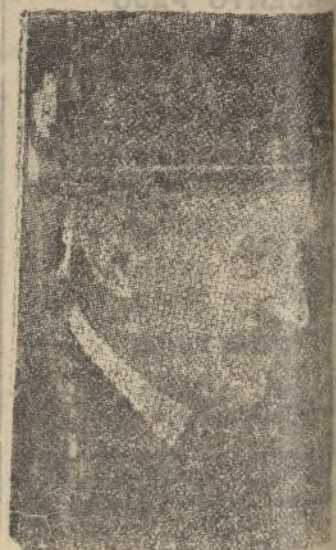
Chautemps, Presidente dimisionario

Se cree que Sarraut rehusó también el encargo por estar convencido de que encontraría una fuerte oposición por parte de comunistas y socialistas al llegar a formar Gobierno.