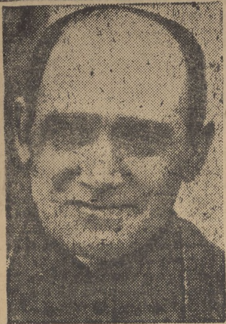
El Cardenal Segura que, dando una nueva prueba de sus predilecciones por Huelva, estuvo ayer presente en la misa de campaña y jura de la bandera de los nuevos sargentos provisionales