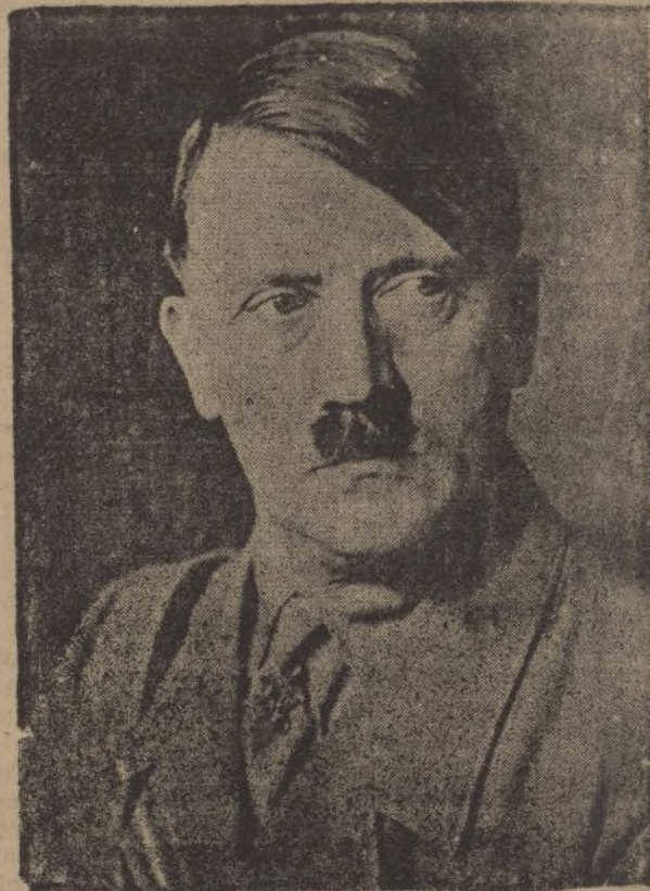
El Fuhrer Adolfo Hitler que acaba de imponer en Austria el nacional-socialismo y que ha sido objeto de un entusiástico recibimiento en Viena

Este discurso de Chamberlain, esperado con el máximo interés refleja la impresión que en la opinión británica han producido los acontecimientos de Austria.