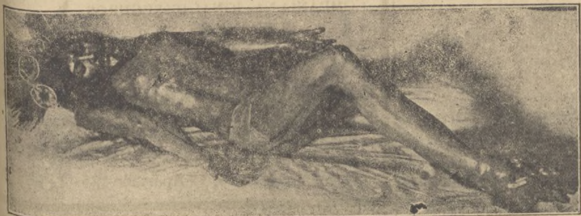
La devotísima imagen del Cristo yacente

Atribuye estos desórdenes y descontento que va siendo cada día mayor, a la mala política francesa, que no ha sabido resolver con tino los problemas de su imperio.