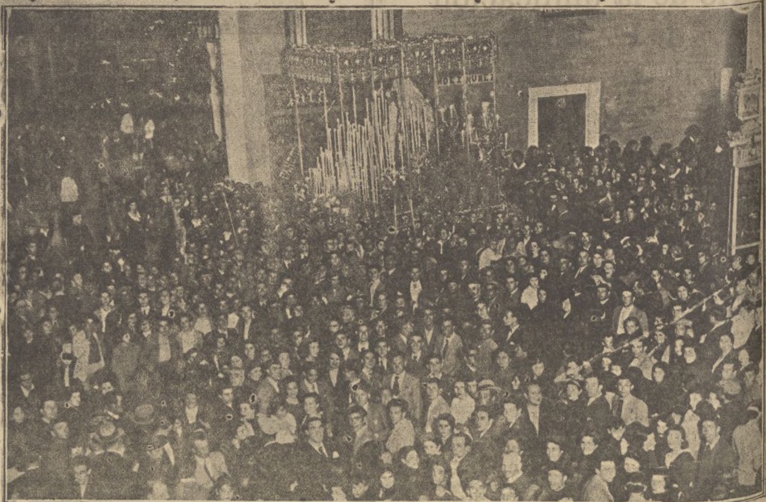
Ayuntamiento de Madrid

Evoquemos aquellas inolvidables mañanas del Viernes Santo en que el pueblo de Huelva se echaba a la calle para rendir su fervorosa devoción a la Virgen de la Amargura antes de su recogida