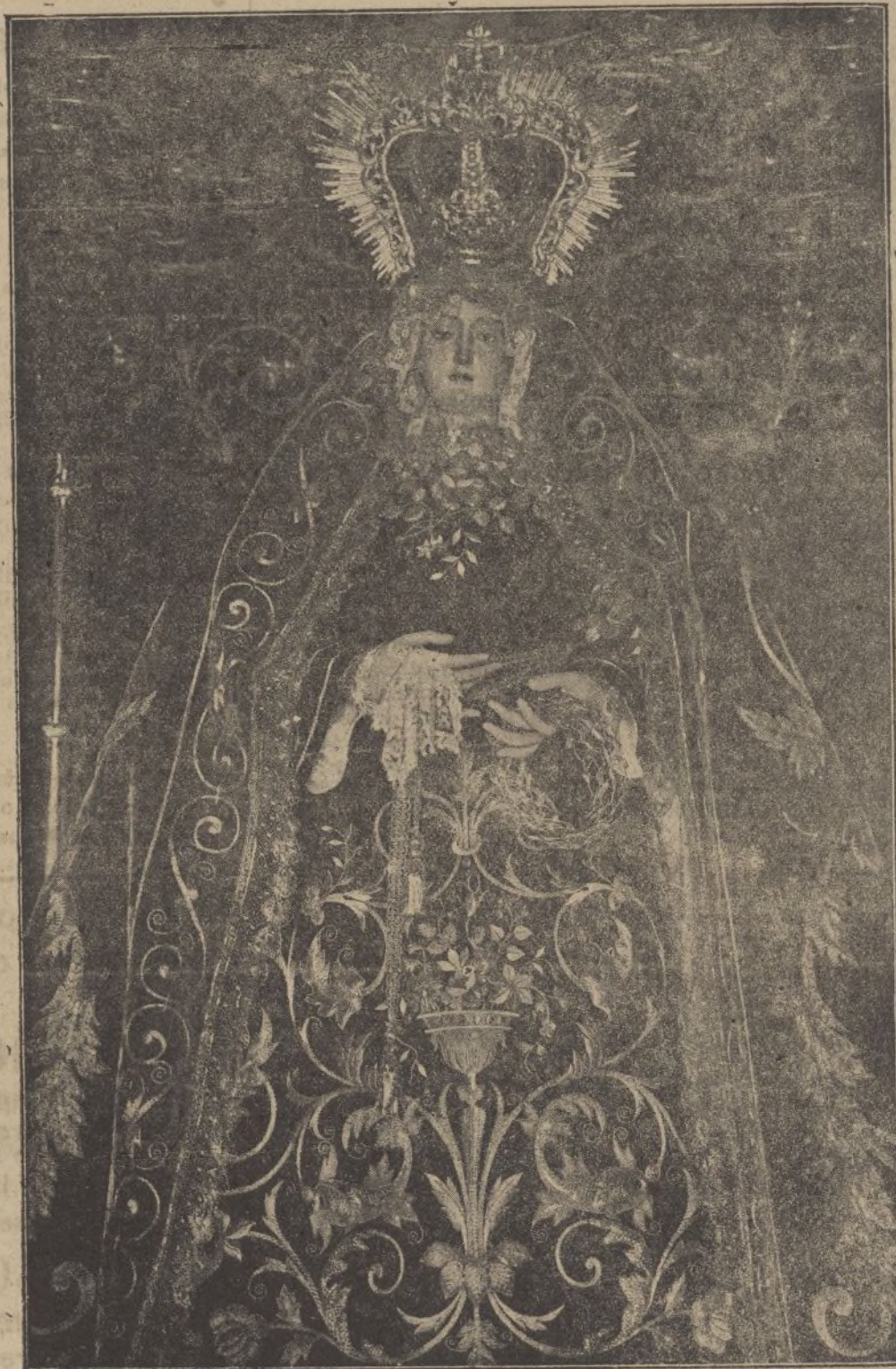
Otra de las imágenes que los rojos redujeron a cenizas en su furia atea. La Virgen de la Soledad los haya perdonado.

Se reciben los donativos en el Almacén de la calle José Nogales, de 9 a 1 de la mañana y de 3 a 5'30 de la tarde. ARRIBA ESPAÑA!