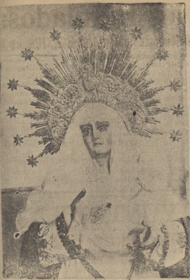
Rendimos un tributo de fervor y de admiración a la memoria—no nos queda otra cosa—de aquella bellísima imagen de María Santísima del Mayor Dolor, de la Iglesia de San Francisco, cuyo recuerdo tantos suspiros arrancó anoche al paso de la Cofradía por las calles de Huelva.