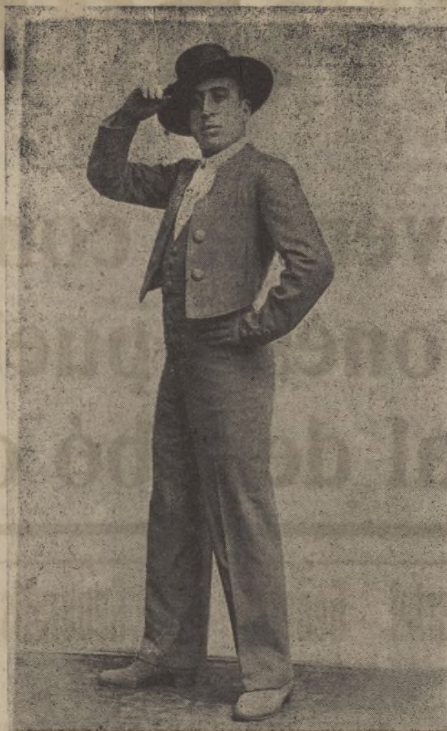
RAFAEL ORTEGA El mago del baile andaluz que hoy debuta en el TEATRO MORA

A los descubrimientos enumerados, con otros muchos que escapan a nuestra pobre erudición, han de agregarse los transcendentes de la circulación de la sangre, del arte de enseñar y de la selección profesional