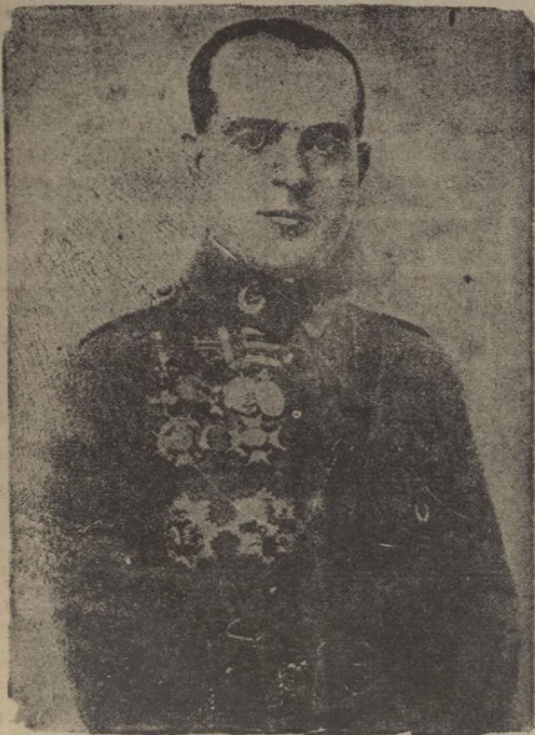
El bilareado general Varela, que ha sido ascendido a general de División

Se reciben los donativos en el Almacén de la calle José Nogales, de 9 a 1 de la mañana y de 3 a 5 de la tarde. ¡ARRIBA ESPAÑA!