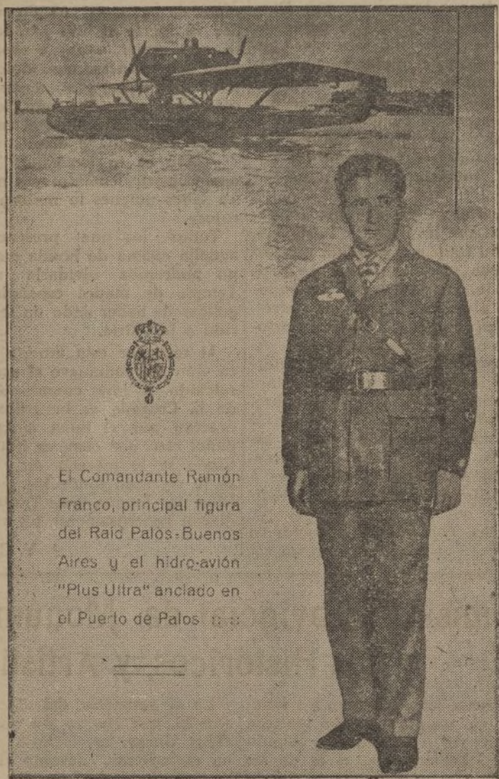
El Comandante Ramón Franco, principal figura del Raid Palos-Buenos Aires y el hidro-avión "Plus Ultra" anclado en el Puerto de Palos.

Llevala al Sr. Presidente de la gran República Argentina y decidle que vea en ella