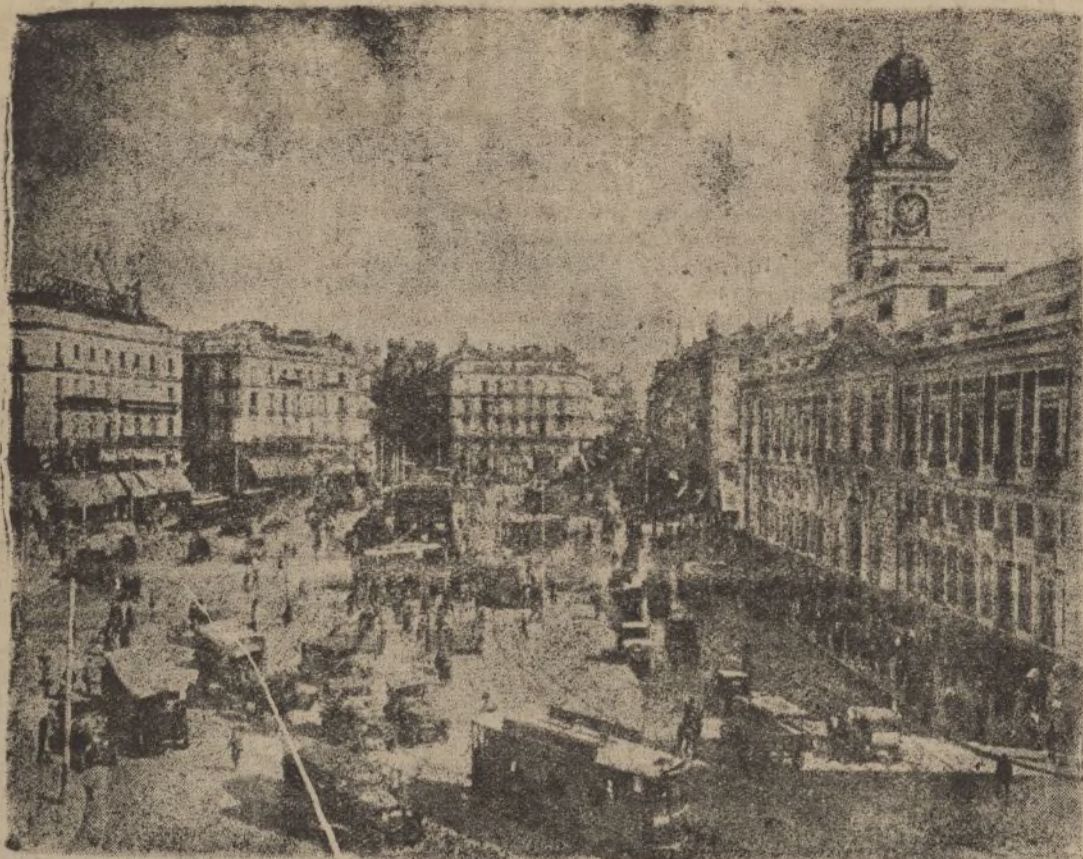
Una vista del Madrid que sufre las inclemencias de la horda roja