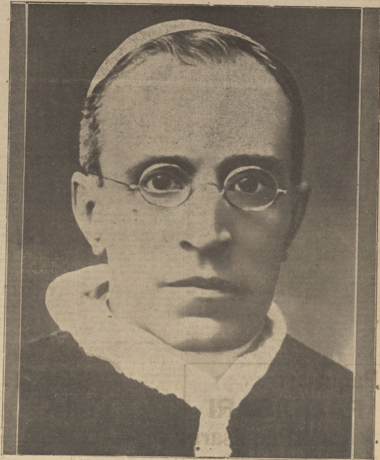
Reciente fotografía del Santo Padre Pío XII