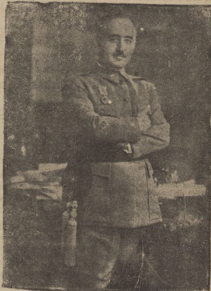
El Caudillo, Generalísimo Franco, que el domingo, en acto cordial y emocionado, ofreció a las madres fecundas españolas las primicias positivas de una ley protectora y de cristiano simbolismo.

Terminada la entrega de los subsidios, el Caudillo y su esposa salieron al jardín para retratarse en compañía de los matrimonios y para que fuesen impresionadas algunas películas. Se empleó en estas fotografías y estas películas mucho más tiempo del que hubiera sido necesario, porque ambos conversaron llanamente con los que le rodeaban. Y ya se había retirado el Caudillo cuando todavía su esposa interrogaba a las mujeres y escuchaba más y más detalles de