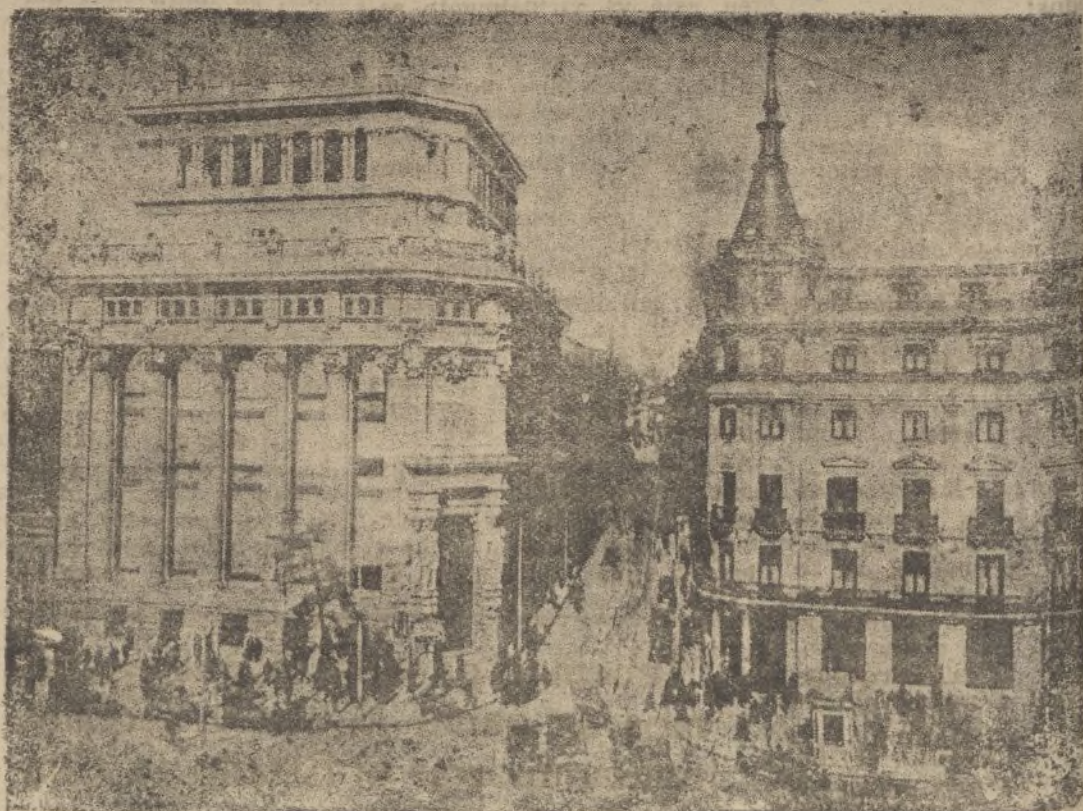
Calle de Alcalá: Bancos Urquijo y Central