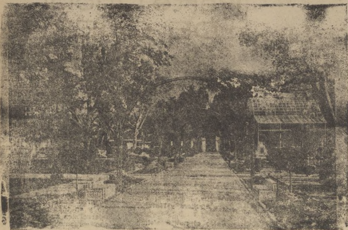
Un aspecto del jardín de la Casa de Fieras

Por la tarde, a las seis, tendrá lugar un solemne «Te-Deum», también en acción de gracias, en la misma Capilla.