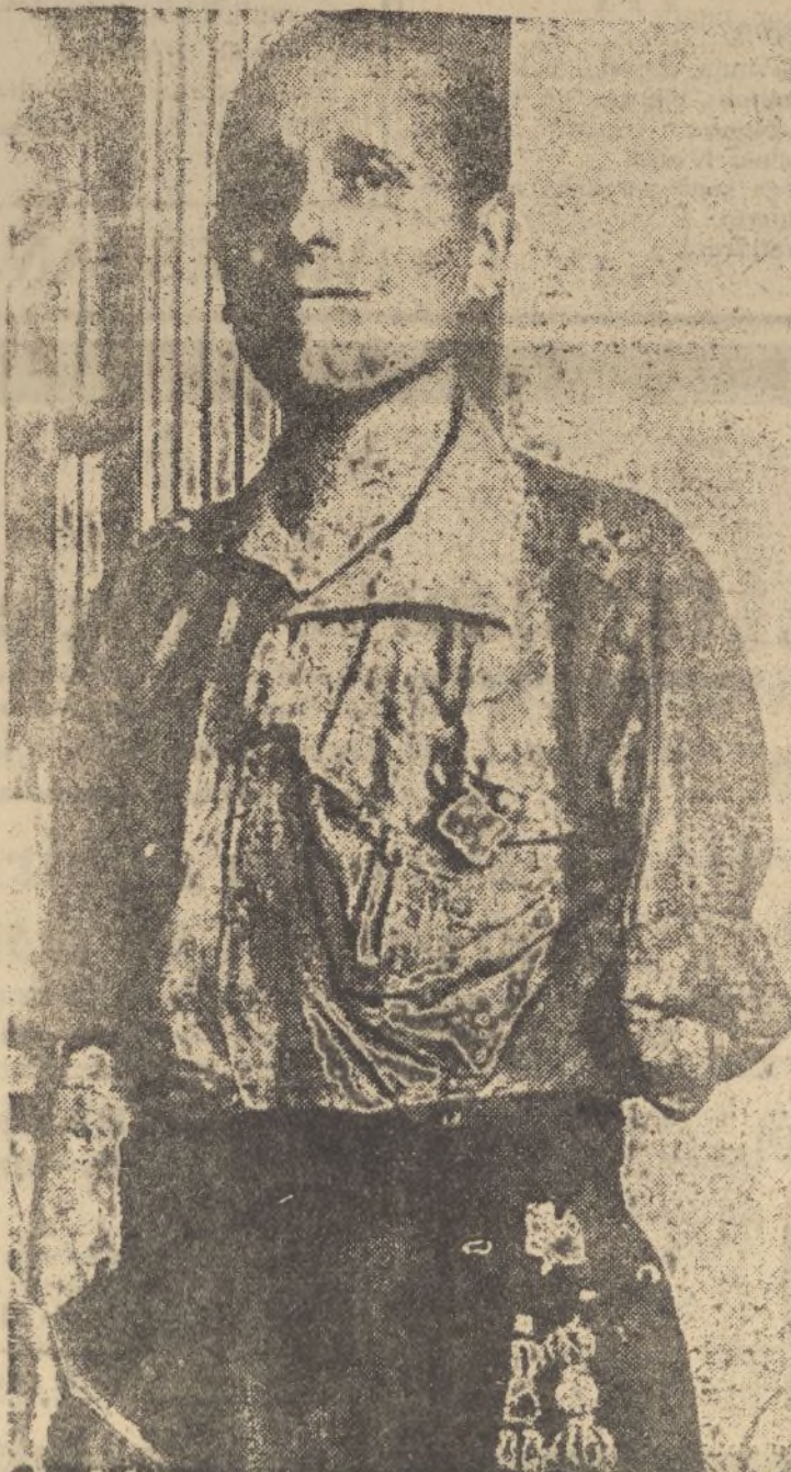
GENERAL MILLÁN ASTRAY