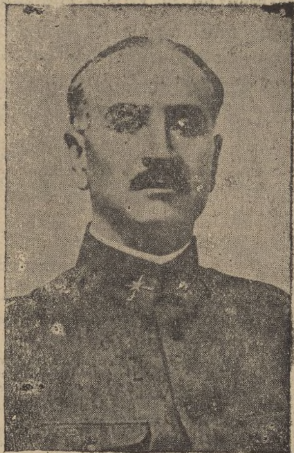
TENIENTE GENERAL QUEIPO DE LLANO

gonar la obra de los egregios, mayor audacia, impulso, fundadores de nuestra unidad nacional con la del invicto Caudillo, que es su continuación. Más tampoco puede desconocerse que la arrogante seguridad de la victoria, que el «Tanto Monta» entraña, tenía ahora un valor mayor. Porque no es lo mismo lanzar el reto desde las supremas alturas del triunfo, que dar a elegir, entre el yugo y las flechas, a ese supremo poder. Atrevida era la afirmación de domoñar a una nobleza turbulenta y rebelde y de vencer a los enemigos, internos y externos, moros y cristianos; pero mayor atrevimen-