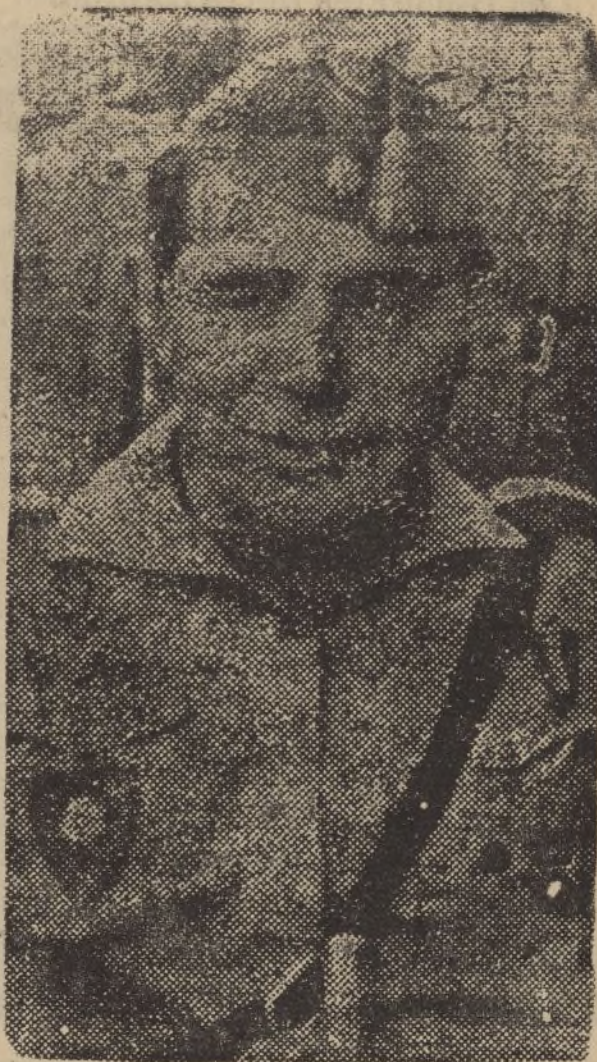
EL GENERAL CASTEJÓN