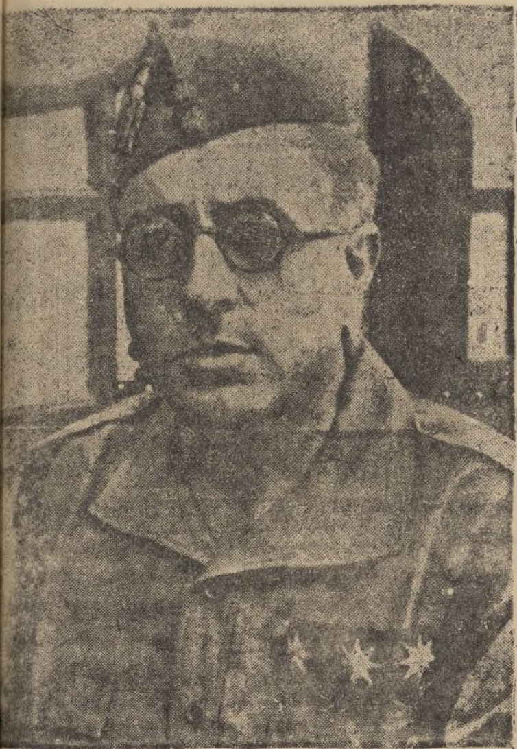
EL GENERAL YAGÜE