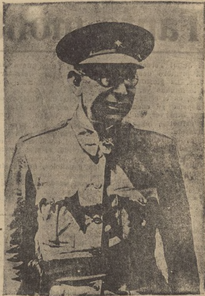
† EL GENERAL MOLA