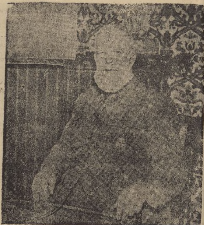
† GENERAL CABANELLAS

En virtud del decreto publicado el del corriente, la correspondencia postal llase gravada con una sobretasa desde al 25, conforme a los términos que se blecen en dicho decreto.