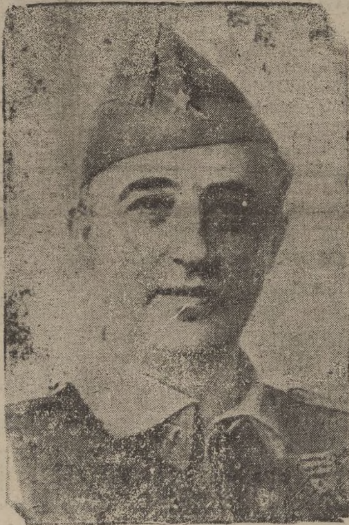
Ilustre Caudillo de España y Presidente del nuevo Gobierno de amplia concentración de valores nacionales, representativos del Ejército, de Falange, del Pueblo y de la Tradición española, síntesis afortunada de una magnífica promesa de dichosas realidades.

Luego, siempre al lado del general Yagüe, fué designado jefe de la Artillería del Cuerpo de Ejército Marroquí que tan fulminantes acciones desarrolló, en las que la eficacia artillera quedará en recuerdo ejemplar de precisión, de ya-