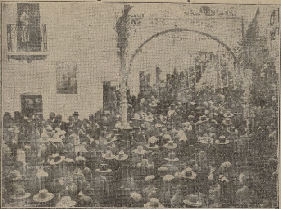
En cada almonteño, un corazón; en cada corazón, un altar, altar consagrado a la Santísima Virgen del Rocío que pasea triunfalmente por las calles de la simpática villa