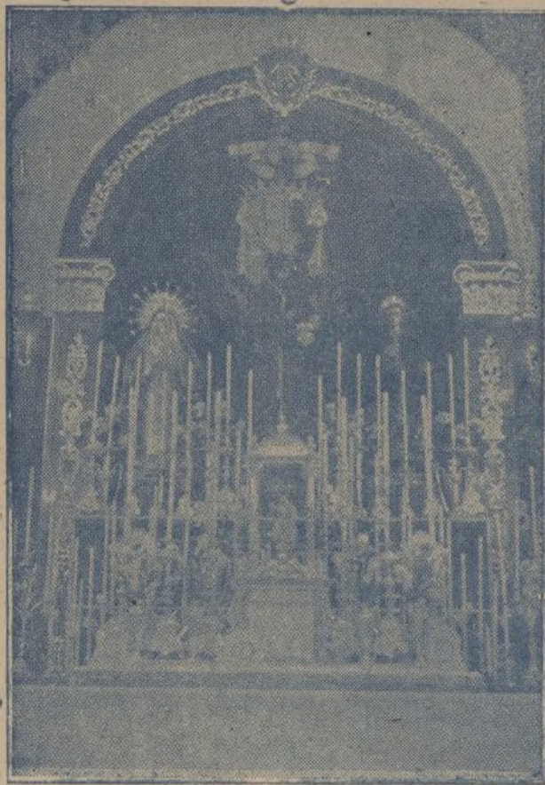
El nuevo altar del Sagrario que la Hermandad de Nuestro Padre Jesús Nazareno ha ofrendado a la Parroquia de la Concepción

... río, con unas parejas de la Guar- dia civil, que dentro del sagra- do recinto prestaban el servir