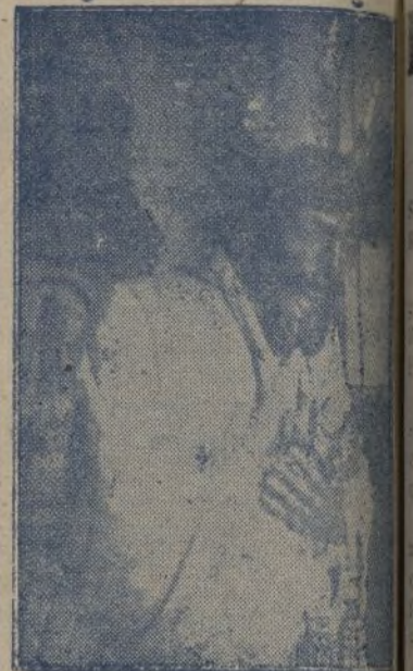
El Nazareno que quemó el marxismo

Bien está que seamos espléndidos en nuestros donativos, pero si nuestras manos dan aunque sea con largueza, y nuestros pies no pisan nunca el umbral de la Parroquia, ni nuestras rodillas no se doblan ante sus altares, entonces tendríamos que creer que dimos por puro compromiso, o por parecer bien, o para que