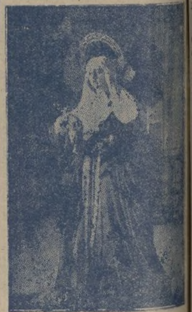
La Virgen de la Amargura desaparecida por los iconoclastas

-Pero nada de esto, puede ferirse al pueblo de Huelva, en ese caso concreto a la fe