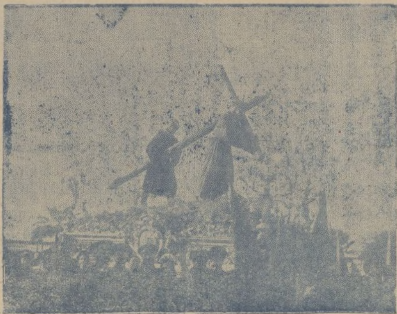
El paso del Nazareno en plena república