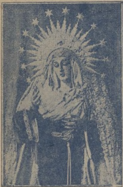
La Virgen de la Amargura bendecida

La reacción se impuso, y el día 20 de Diciembre de 1936 se