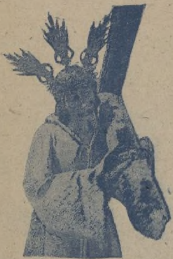
El Nazareno recientemente adquirido

Efímero y harta deleznable fué el triunfo y, con el triunfo, la tiránica hegemonía de la chusma roja. España, con sus soldados, con sus requetés, con sus falangistas, con sus hombres decentes, en una palabra, puso en cobarde y vergonzosa huida a las alimañas marxistas, barriéndolas para siempre del solar patrio.