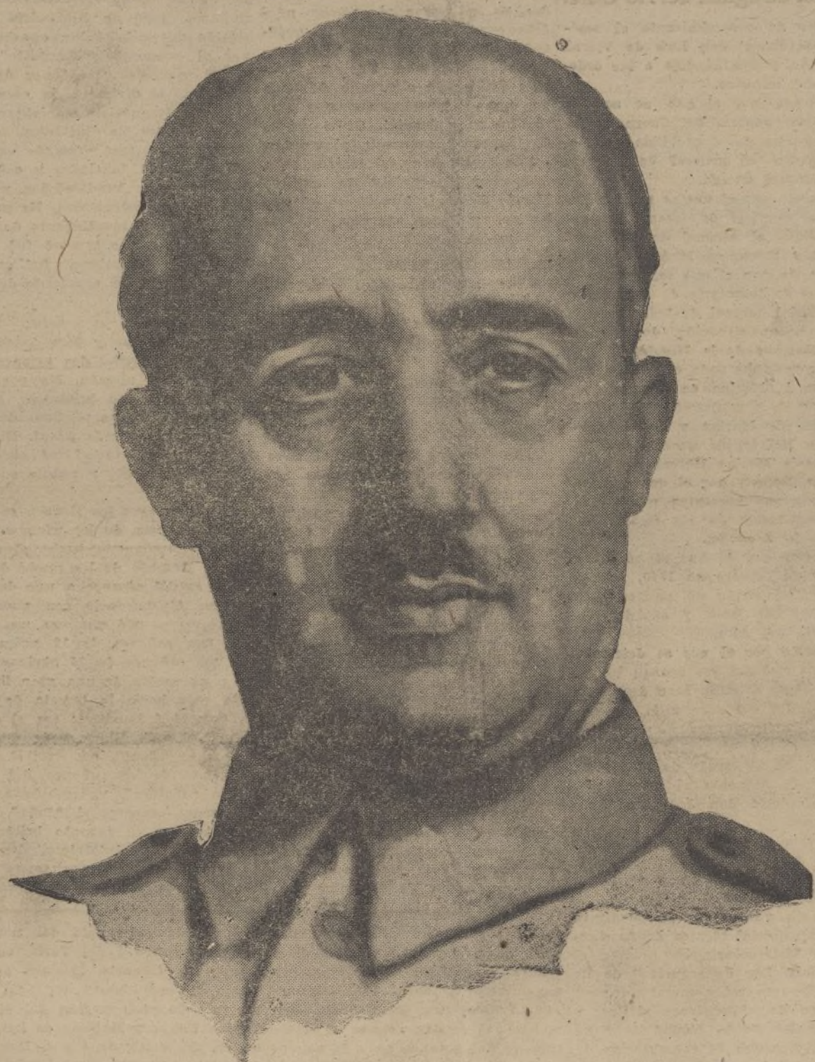
El Caudillo victorioso de España, en cuyo derredor se agrupan todos los buenos españoles hacia el camino de la victoria de la paz, que ha de llevarnos al triunfo definitivo del porvenir seguro de la Patria

EN PRIMERA LINEA entre los Semanarios Hogar españolista está "Medina". Mujer, léelo. — Arte, Modas, Literatura.