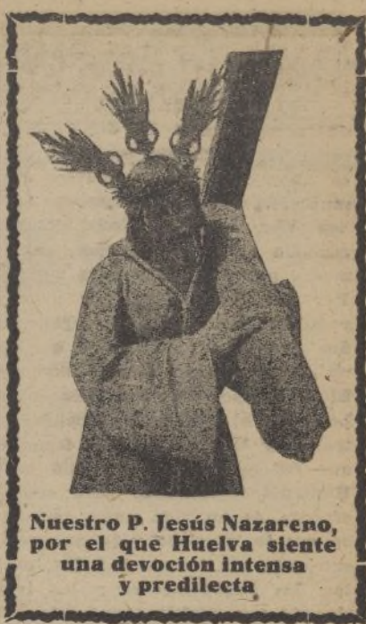
Nuestro P. Jesús Nazareno, por el que Huelva siente una devoción intensa y predilecta