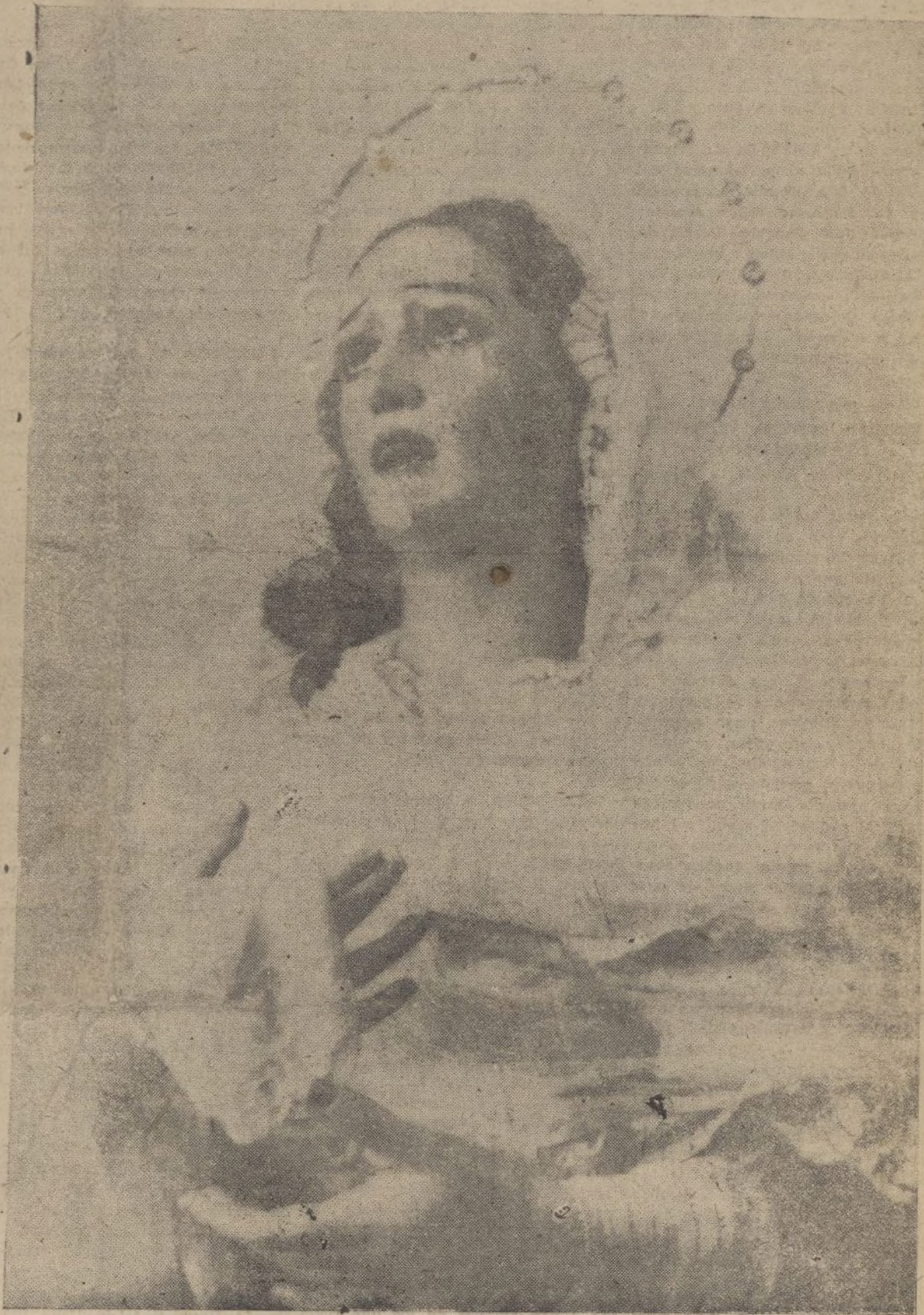
Sagrada efigie de Nuestra Señora de la Consolación en sus Dolores que figura en el "paso" de la Cofradía de los Estudiantes que hoy jueves, a las 7 y media de la tarde, hace estación desde la parroquia de la Purísima Concepción

Ya Jesús anunció su sacrificio, y de precioso unguento se ha bañado; ya el Apóstol traidor se ha señalado vendiéndolo a Caifás con beneficio.