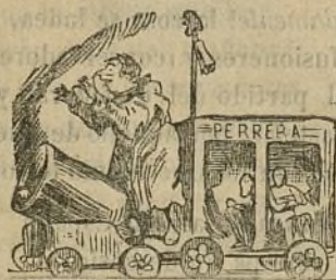
VIAJE EN LA PERRERA CENCERRO-CARRIL.

república y la monarquia no caben juntos en un costal, no es menester tantas matemáticas, hermanito conservador.