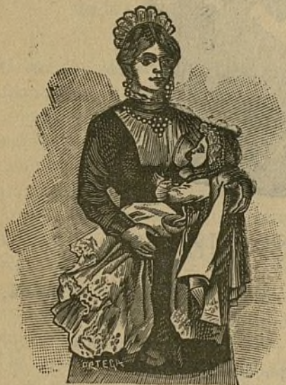
EL AMA DE CRÍA.

Porque si el delirio de nuestros gobernantes llega hasta ese extremo, será cosa de tener que abandonar la tierra donde hemos nacido para buscar otra donde se rinda culto á la ley y á la justicia en vez del fanatismo y la sinvergazonería.