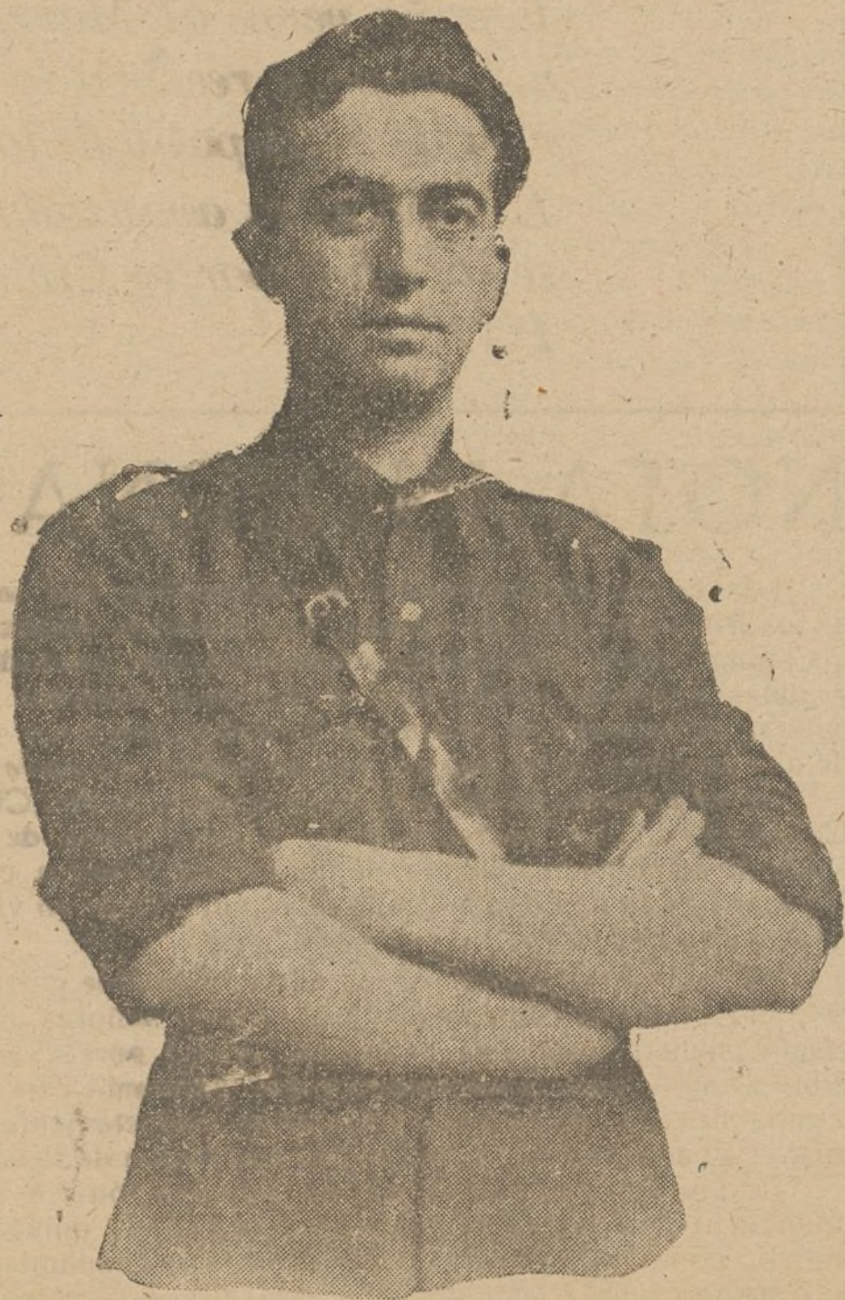
Onésimo Redondo, Caudillo de Castilla ¡Presente!

Nace en Quintanilla de Abajo (Valladolid), el 16-11-1905. La humildad de su cuna da a su niñez y juventud días laboriosos, angostos, fecundos. Doctorado en Leyes en Salamanca, abre su espíritu a Europa y al pensamiento mundial «leyendo castellano» en la Universidad de Mannheim. En España se convierte en el Apóstol de Castilla. Caudillo de Juventudes, forma hombres de España. Dinámico, infatigable, funda LIBERTAD, escribe la teoría constitucional del Nuevo Estado, habla a multitudes, organiza milicias, despierta a Castilla de su letargo secular. El 19 de julio de 1936, sale de la cárcel para ponerse al frente de la Revolución Nacional en armas. No puede gozar el triunfo porque cae asesinado en Labajos (Segovia), el 24. Patriota ardiente, político genia!, fué el primero que en España supo conciliar su fe católica con el más sincero espíritu revolucionario.